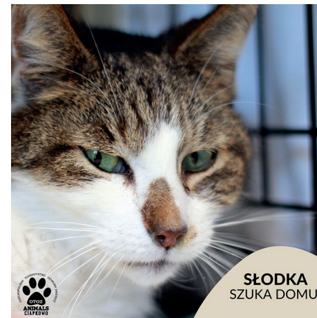
SŁODKA SZUKA DOMU

Posiada ważne szczepienia, jest odrobaczony, odpchlony i wykastrowany.