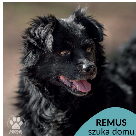
REMUS szuka domu

Kontynuujemy rubrykę, dzięki której, mamy nadzieję, kolejne porzucone psy i koty ze schroniska w „Ciapkowie” znajdą ciepły dom. Miejskie schronisko „Ciapkowo” prowadzone jest przez Ogólnopolskie Towarzystwo Ochrony Zwierząt Animals.