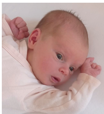
Laura, 29.09., 54 cm, 3660 g