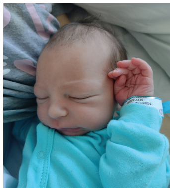
Jan, 21.10., 52 cm, 3600 g