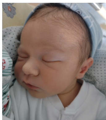
Seweryn, 20.10., 52 cm, 3460 g