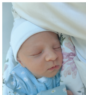
Nela, 20.10., 53 cm, 3060 g