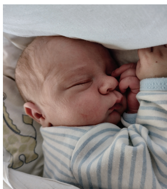
Przemysław, 18.10., 57 cm, 4000 g