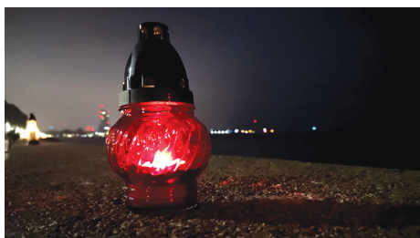
1 i 2 listopada nasze myśli biegną ku tym, którzy odeszli.

Tych, którzy odeszli, wspominamy na str. 9 „Ratusza”.