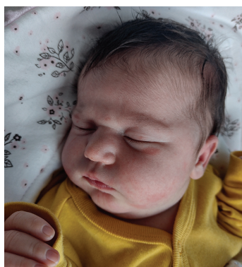
Magdalena, 19.10., 58 cm, 4120 g