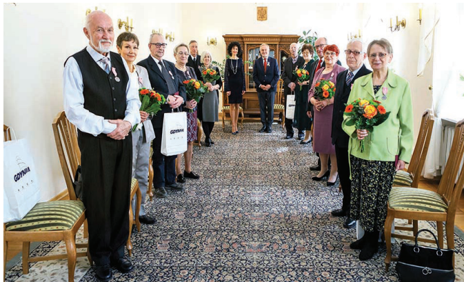
Na zdj. pary, które brały udział w uroczystości 4 kwietnia o godz. 13:00

Wszystkim parom składamy serdeczne gratulacje i życzymy jeszcze wielu pięknych, wspólnych lat!