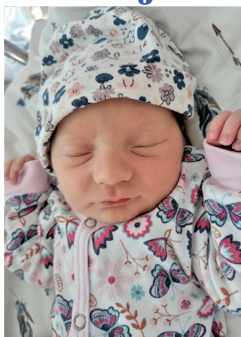
Adela , 54 cm, 3210g, 7.04.