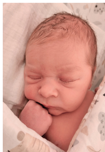
Leonardo , 52 cm, 3615 g, 8.04.