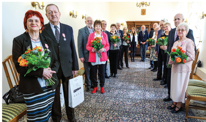
Na zdj. jubilaci biorący udział w uroczystości 7 kwietnia o godz. 13:00