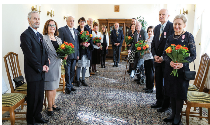
Na zdj. jubilaci biorący udział w uroczystości 7 kwietnia o godz. 15:00