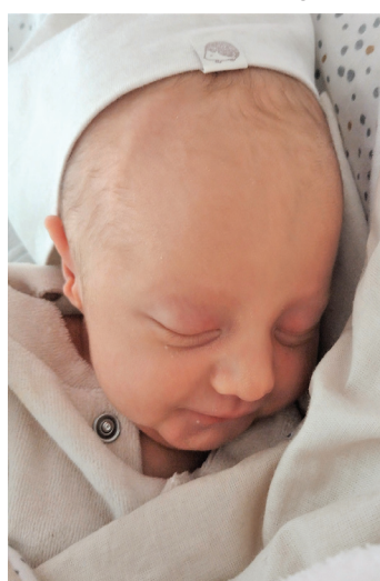
Pola , 50cm, 2500g, 6.04