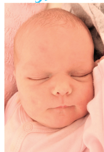
Milena , 53 cm, 2990 g, 2.04