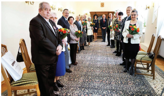
Na zdj. pary, które brały udział w uroczystości 4 kwietnia o godz. 15:00