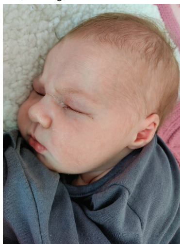
Pola , 58 cm, 4290 g, 30.03