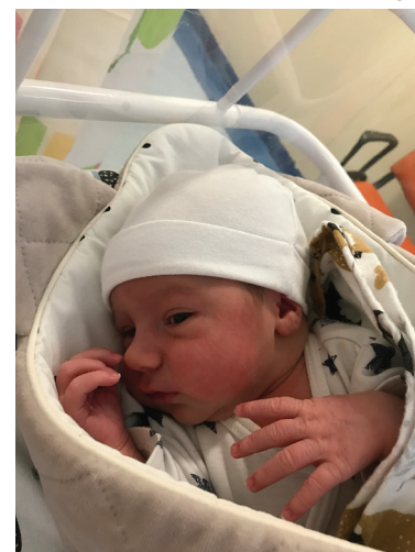
Jan 54 cm, 3530 g, 28.03 (Szpital św. Wojciecha w Gdańsku)