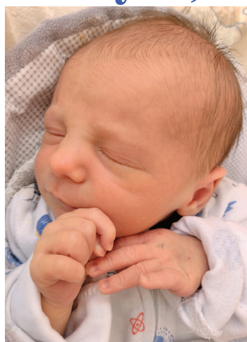
Jagna , 50 cm, 2590 g, 31.03