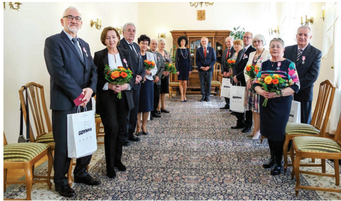
Na zdj. pary, które brały udział w uroczystości 4 kwietnia o godz. 14:00