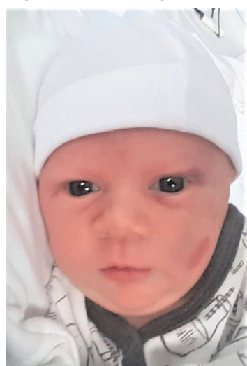
Zachariasz , 54cm, 3040 g, 5.04