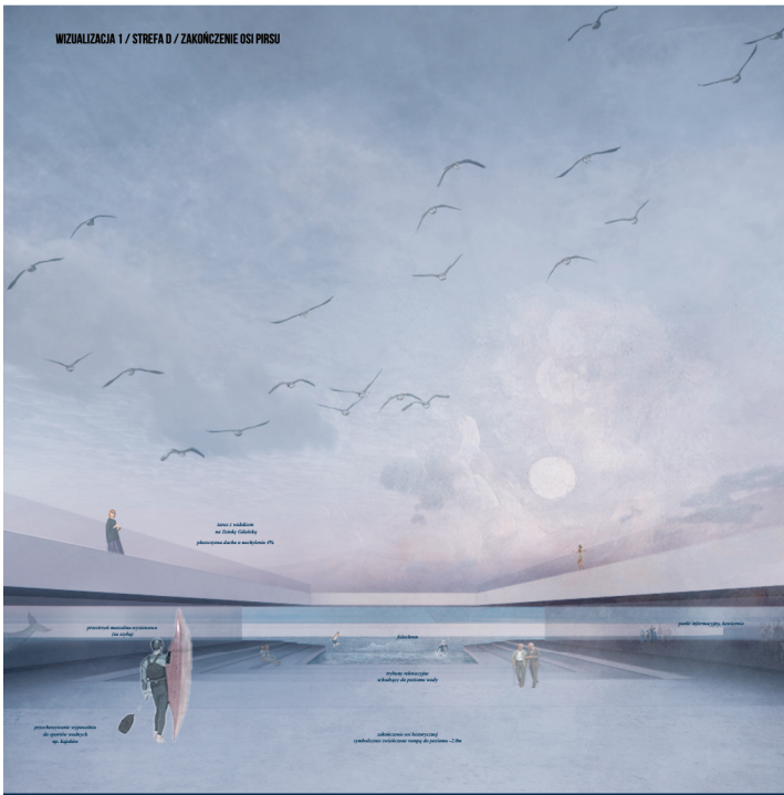
WIZUALIZACJA 1 / STREFA D / ZAKOŃCZENIE OSI PIRSU