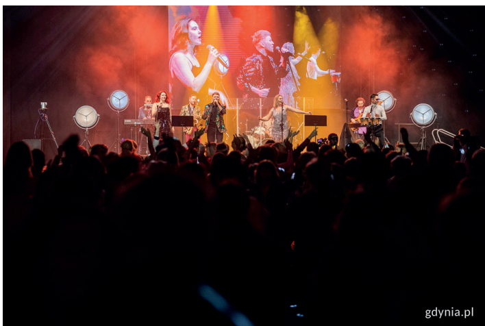
Gdynianie tańczący do hitów lat 70. i 80. podczas koncertu „Tyle słońca w całym mieście” w Polsat Plus Arenie Gdynia

W dobrych nastrojach, z uśmiechami na twarzy i w rytmie przebojów z lat młodości – tak gdynianie świętowali w Polsat Plus Arenie Gdynia. Atrakcje i program przygotowano przede wszystkim z myślą o seniorach. Były strefy urody i zdrowia czy porady specjalistów. Nie zabrakło też hucznej zabawy. Podczas koncertu „Tyle słońca w całym mieście” królowały hity lat 70. i 80.