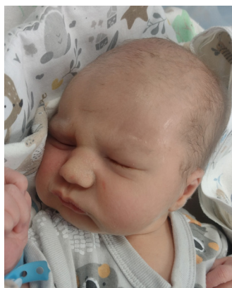
Leon , 56 cm, 3540 g, 31.01.24