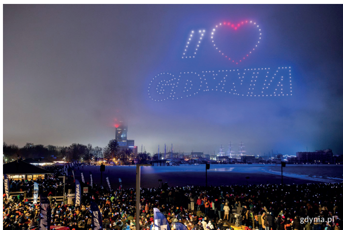
Napis „I love Gdynia” na niebie nad gdyńską plażą zakończył magiczny taniec dronów// Fot. Karol Stańczak