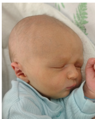
Jan , 55 cm, 3290 g, 23.01.24 r.