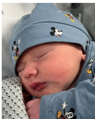
Franciszek , 52 cm, 3160 g, 24.01.24 r.