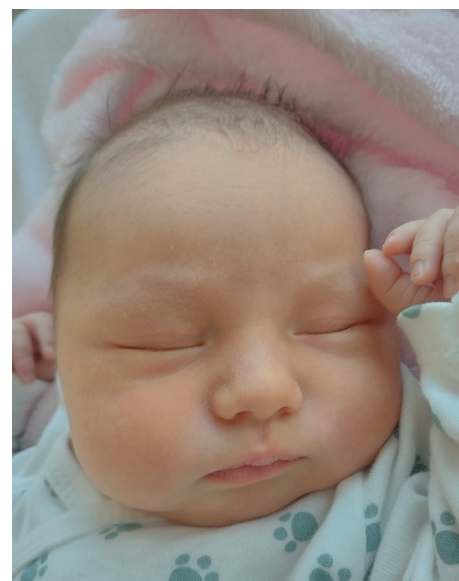
Lilia , 54 cm, 3590 g, 6.09