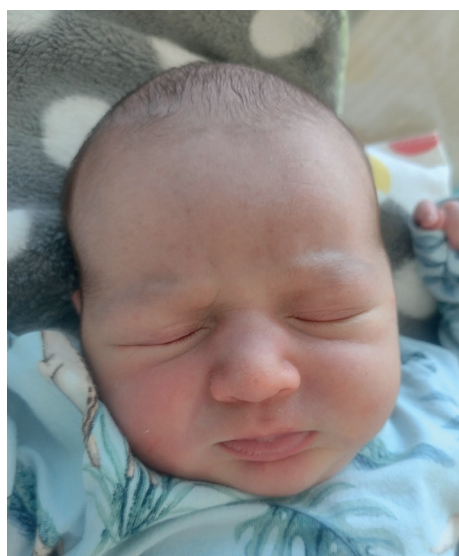
Teo , 54 cm, 3790 g, 5.09