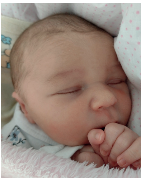
Pola , 52 cm, 3130 g, 4.09