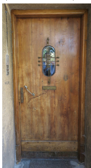
renowacja przedwojennej stolarki drzwiowej

GDZIE SPRAWDZĘ W JAKIEJ GRUPIE OCHRONY KONSERWATORSKIEJ W MIEJSCOWYM PLANIE ZAGOSPODAROWANIA PRZESTRZENNEGO ZNAJDUJE SIĘ MÓJ BUDYNEK?