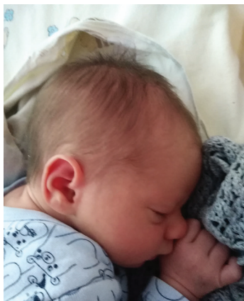
Maria , 21.07., 57 cm, 3160 g