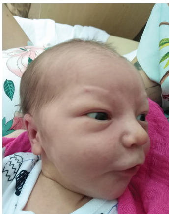
Feliks , 21.07., 51 cm, 3200 g