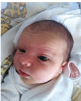
Pysia , 20.07., 56 cm, 3790 g