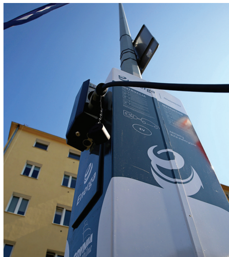
Ładowanie ze słupów oświetleniowych pozwoli używać aut elektrycznych także w dzielnicach