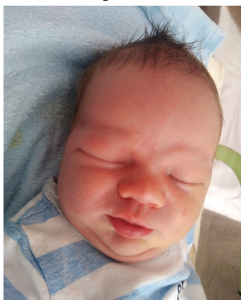
Leon , 24.06., 56 cm, 3800 g