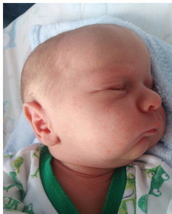
Kuba , 30.06., 56 cm, 3550 g