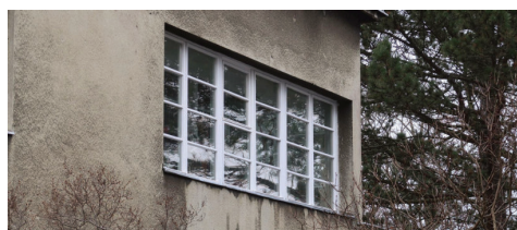
renowacja przedwojennej stolarki okiennej