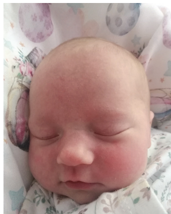
Leokadia , 30.06., 51 cm, 3030 g