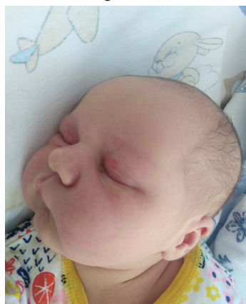
Leon , 27.06., 72 cm, 4170 g