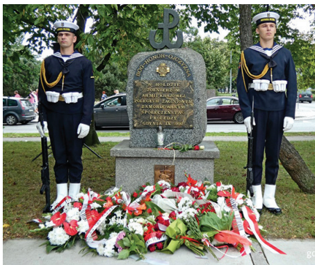
Posterunek honorowy przy pomniku Armii Krajowej na skwerze Kościuszki podczas uroczystości z okazji 77. rocznicy wybuchu powstania warszawskiego

W hołdzie bohaterom w historyczną godzinę „W”, czyli punktualnie o godz. 17.00, w mieście zawyły syreny.