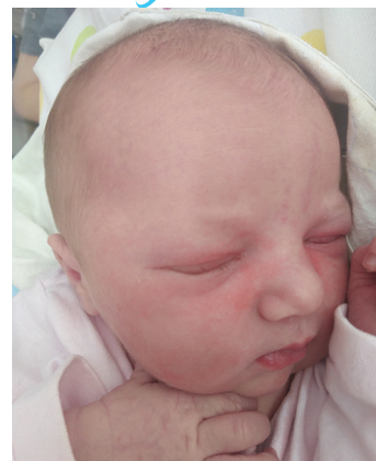
Awia , 20.07., 57 cm, 3930 g