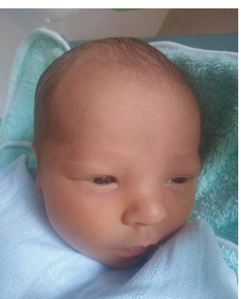
Stefan , 20.07., 51 cm, 3150 g