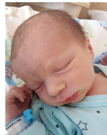
Jan , 21.07., 54 cm, 2740 g