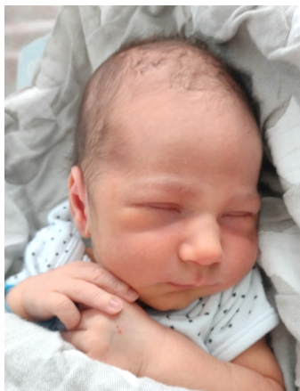
Gabryś, 54 cm, 3600 g, 12.07.23