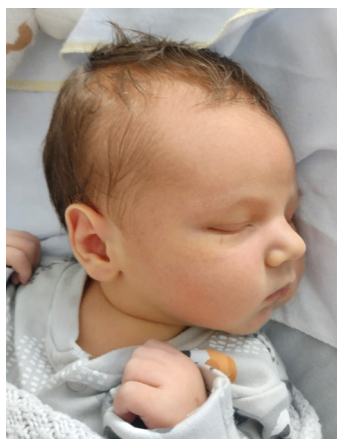
Tymon, 54 cm, 3880 g, 12.07.23