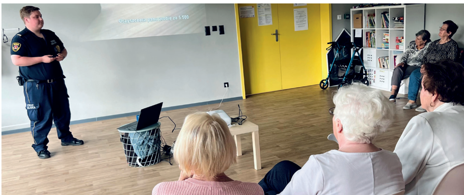
Wakacyjne warsztaty z funkcjonariuszami Straży Miejskiej w Gdyni

Wakacje to również czas spotkań zarówno z dziećmi, jak i dorosłymi odbiorcami profilaktyki społecznej. Odbývają się zajęcia w placówkach niepublicznych. Organizowane są także prelekcje z zakresu bezpieczeństwa seniorów, podczas których strażnicy opowiadają o popularnych metodach oszustw i sposobach radzenia sobie w przypadku niepokojących zdarzeń. Zrealizowano także zajęcia, podczas których strażnicy wraz z osobami uczestniczącymi próbowali odpowiedzieć na pytanie „Jak zrozumieć dzisiejszą młodzież?”. Goście mogli porozmawiać (między innymi) o tym co można znaleźć na popularnych platformach społecznościowych, czy też kto jest autorytetem dzisiejszych nastolatków i skąd moi ludzie czerpią inspiracje.