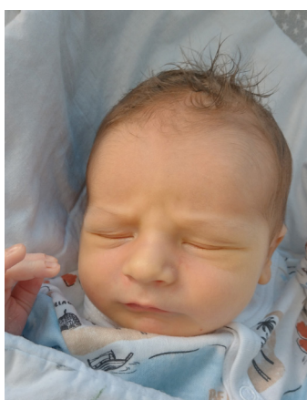
Tytus, 52 cm, 3860 g, 15.07.23