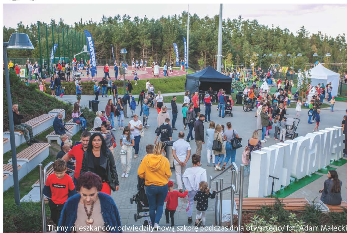
Tłumy mieszkańców odwiedziły nową szkołę podczas dnia otwartego