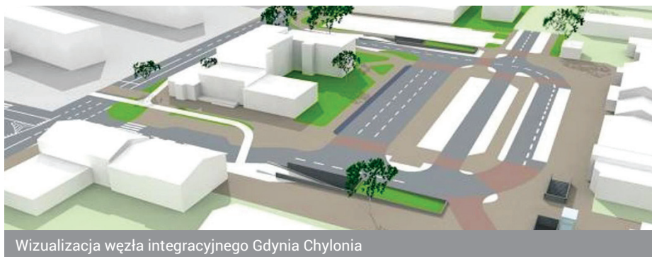
Wizualizacja węzła integracyjnego Gdynia Chylonia

Wiceprezydent Gdyni ds. edukacji i zdrowia