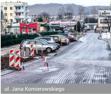
ul. Jana Komierowskiego