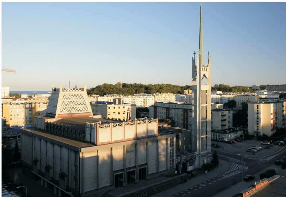
Widok ogólny, elewacja frontowa, po prawej wolnostojąca wieża dzwonna wybudowana w 1981 r.