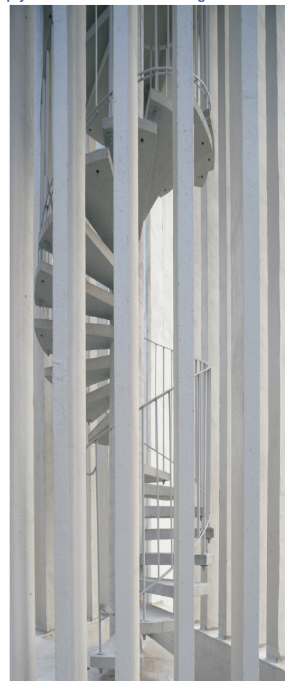
Ażurowe schody zlokalizowane wewnątrz wolnostojącej wieży dzwonnej z 1981 r.