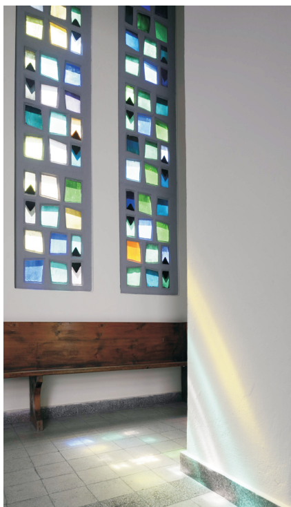
Wnętrze kościoła - witraże o zimnych barwach od strony południowej