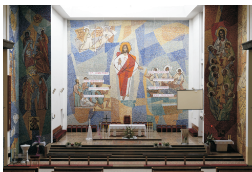
Prezbiterium, monumentalna mozaika zaprojektowana przez Bogumiła Marszałę w 1968 r.