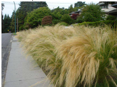
Ostnica mocna odm. Pony Tails