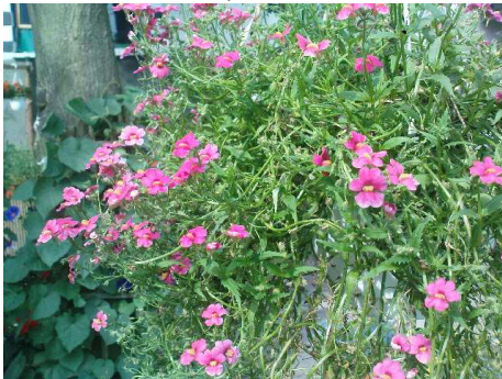
Diaskia o różowych kwiatach