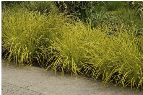
Turzyca sztywna odm. Aurea