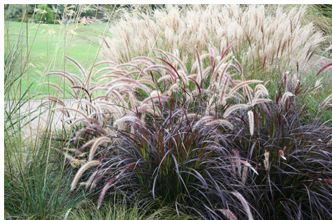
Rozplenica szczecinkowata odm. Rubrum