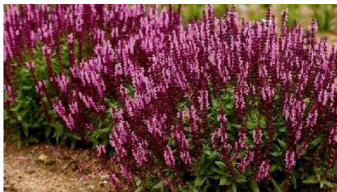
Szałwia odm. różowa