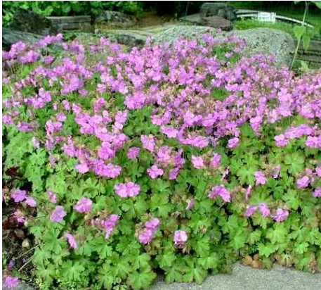
Bodziszek kantabryjski odm. Cambridge