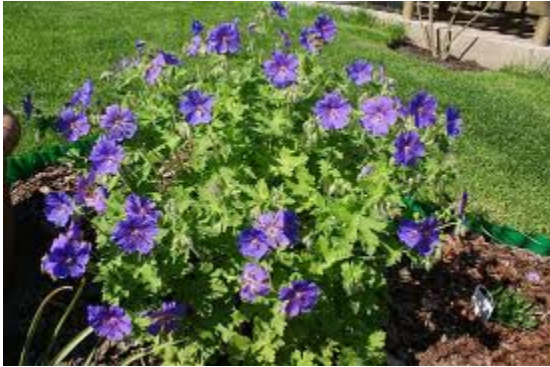
Bodiszek himalajski odm. Gravetye