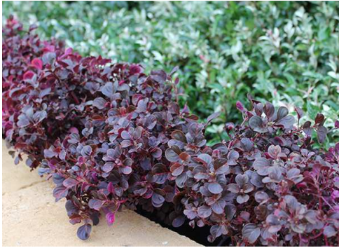
Irezyna odm. Purple Lady