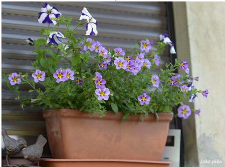
Diaskia o fioletowych kwiatach