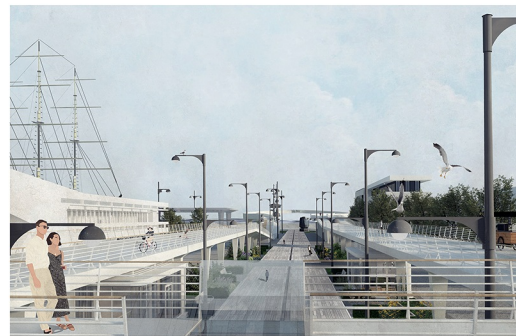
Widok E - widok z trasy łączącego dwa trakty nadziemnej promenady