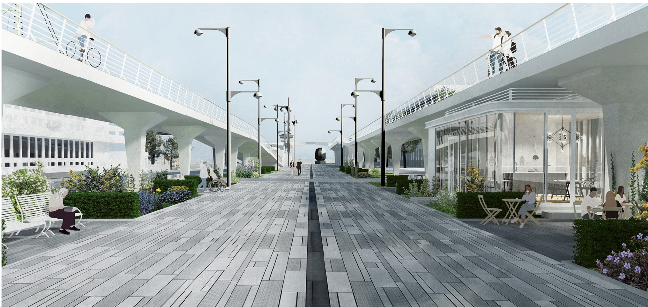
Widok D - widok z przestrzeni na głównej oś, przy Alei Jana Pawła II, między traktami nadziemnej promenady