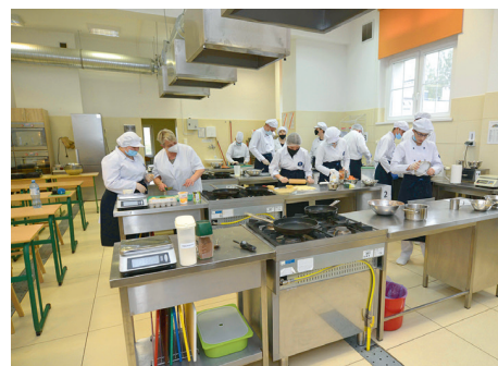
Wyposażona w nowoczesny sprzęt AGD pracownia gastronomiczna w Zespole Szkół Hotelarsko-Gastronomicznych