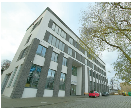
Nowy budynek warsztatów szkolnych w Centrum Kształcenia Zawodowego i Ustawicznego nr 1 oddany do użytku w 2021 r.