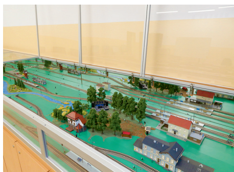
Makieta kolejowa ze stacjami i urządzeniami sygnalizacyjnymi w Zespole Szkół Ekologiczno-Transportowych