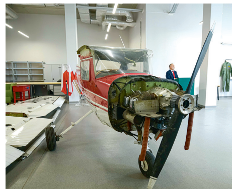
W CKZiU nr 1 uczniowie mają do dyspozycji m.in. samolot, który pomoże w edukacji mechaników lotniczych