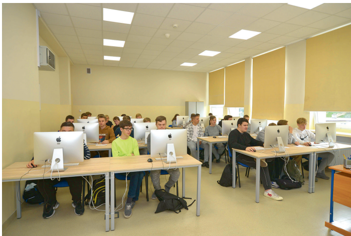
Odnowiona pracownia informatyczna z nowoczesnym sprzętem komputerowym w Zespole Szkół Chłodniczych i Elektronicznych