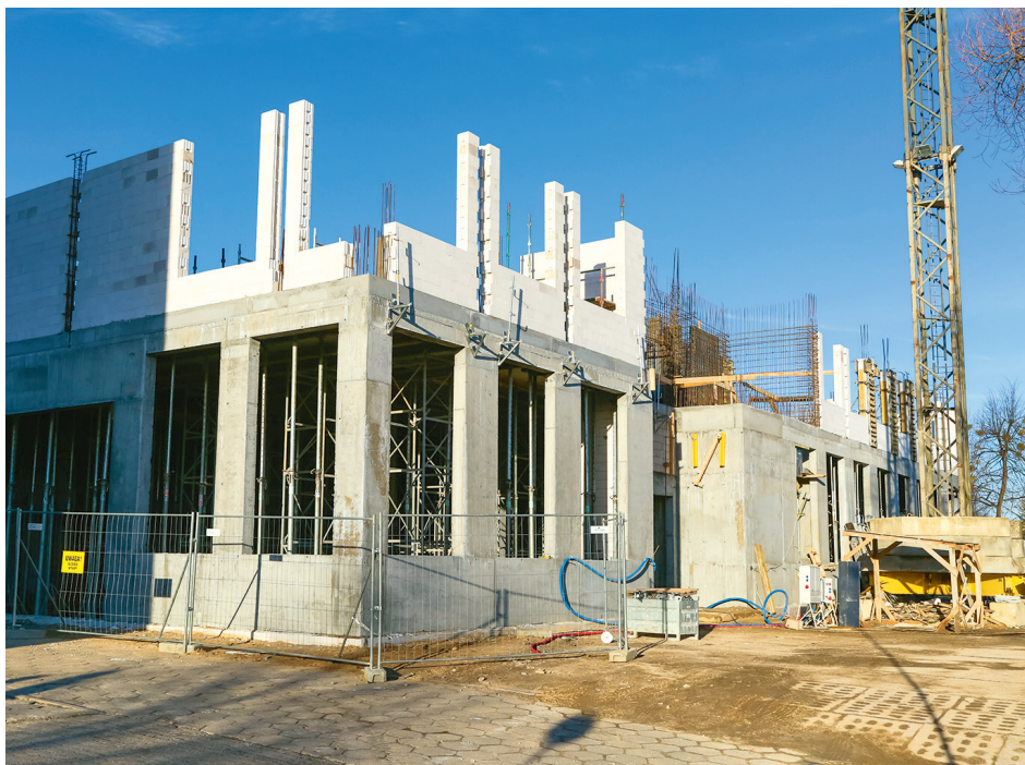
Budowa nowego budynku warsztatów szkolnych w Centrum Kształcenia Zawodowego i Ustawicznego nr 1

W rezultacie realizacji projektu „Rozwój szkolnictwa zawodowego w Gdyni – budowa, przebudowa i rozbudowa infrastruktury szkół zawodowych oraz wyposażenie” utworzone zostały odpowiednie warunki do podniesienia jakości kształcenia zawodowego, a także jego do-