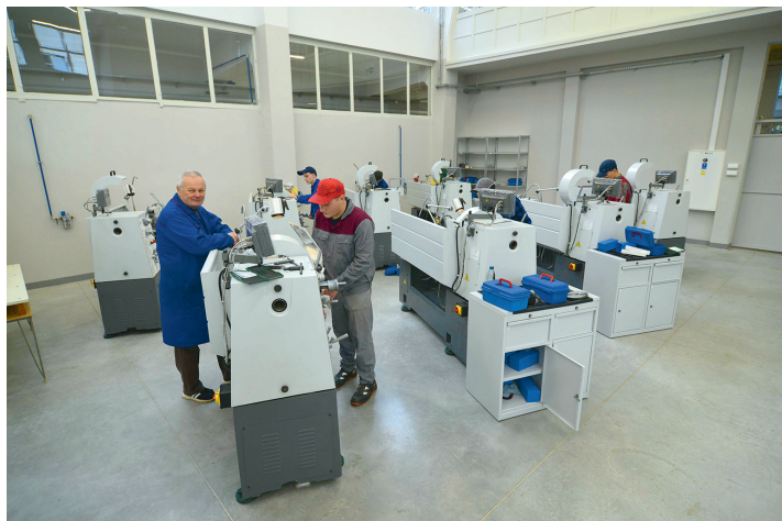
Praktyczne zajęcia z wykorzystaniem specjalistycznego wyposażenia w całkowicie odnowionych warsztatach w Centrum Kształcenia Zawodowego i Ustawicznego nr 1