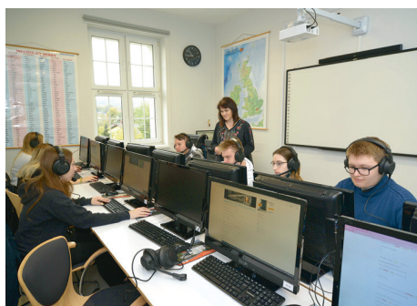
Odnowiona i wyposażona w profesjonalny sprzęt pracownia komunikacji w języku obcym w Zespole Szkół Administracyjno-Ekonomicznych