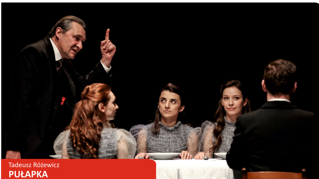
Tadeusz Różewicz PUŁAPKA

Tajemnicze związki, burzliwe rozstania i wizje przyszłości - opowieść o życiu jednego z największych pisarzy XX wieku.