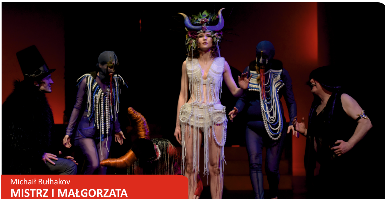
Michaił Bułhakov MISTRZ I MAŁGORZATA

Fascynujący świat, w którym dobro i zło współistnieją na równych warunkach, miłość zbawia świat, a każdy, nawet szatan, ma szansę na ocalenie.