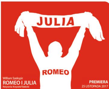
William Szekspir ROMEO I JULIA Reżyseria: Krzysztof Babicki

GRAMY: 7, 8, 10, 11, 12, 13, 15 PAŹDZIERNIKA; 2, 8, 9, 12 LISTOPADA