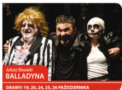
Juliusz Słowacki BALLADYNA

GRAMY: 30 WRZEŚNIA; 1 PAŹDZIERNIKA; 17, 18, 19 LISTOPADA