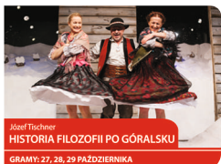
Józef Tischner HISTORIA FILOZOFII PO GÓRALSKU