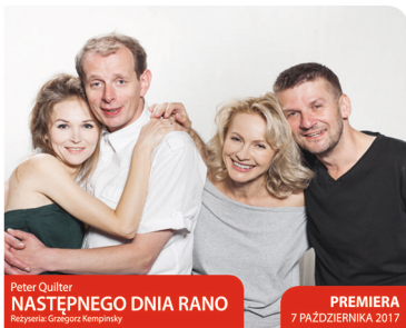
Peter Quilter NASTĘPNEGO DNIA RANO Reżyseria: Grzegorz Kempnisky