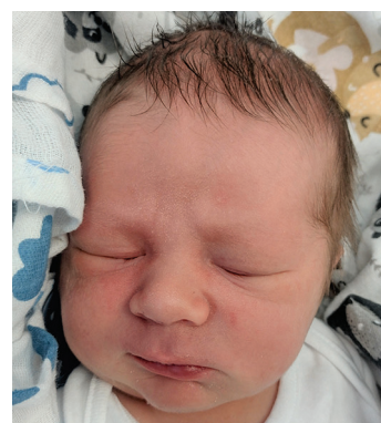
Kuba , 3.08, 55 cm, 3730 g