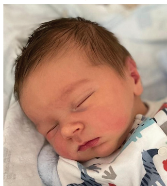
Antoni , 25.07, 56 cm, 3700 g