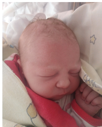
Róża, 13.08, 52 cm, 2980 g