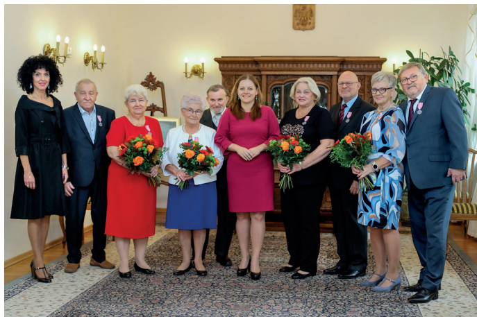
Uroczystość o godz. 15:00