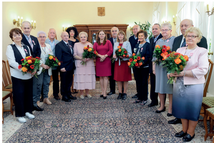
Uroczystość o godz. 14:00