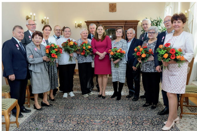
Uroczystość o godz. 13:00