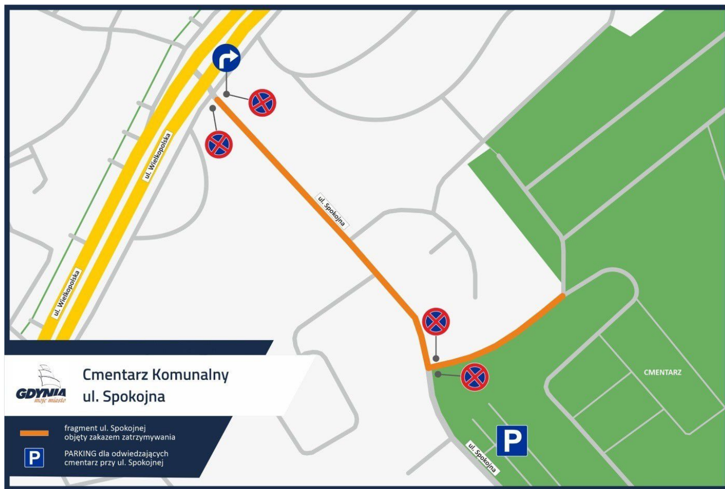
Mapka nr 3