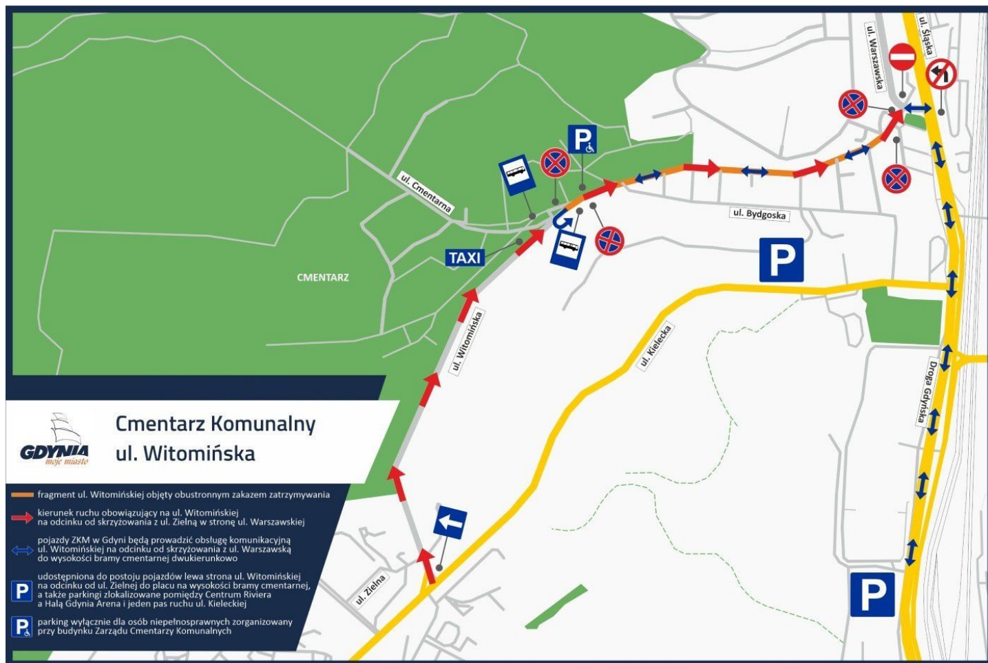
Mapka nr 1

Jak co roku w związku z okresem Wszystkich Świętych wprowadzone zostaną zmiany w organizacji ruchu w okolicy gdyńskich nekropoli. Jak dojechać do największych cmentarzy w okresie Wszystkich Świętych? Sprawdźmy, jak się zmieni organizacja ruchu przy trzech gdyńskich nekropoliach i cmentarzu w Kosakowie oraz na co warto zwrócić uwagę w rozkładzie jazdy komunikacji miejskiej. Zmiany w organizacji ruchu będą dotyczyć trzech gdyńskich nekropoli. Obowiązywać będą od późnych godzin wieczornych 30.10.2024 r. do 3.11.2024 r. (do godz. ok. 18:00) . Organizacja ruchu zmieni się również w okolicy cmentarza w Kosakowie.