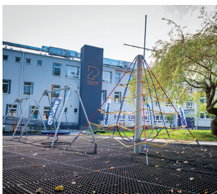
Dziedziniec Przystani Śmidowicza 49 jest otwarty dla mieszkańców