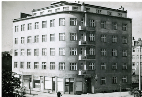
Kamienica na zdjęciu archiwalnym z końca lat 30. XX w.

Ta część Śródmieścia położona najbliżej portu bardzo się zmienia na naszych oczach. Powstają nowe budynki a także historyczne domy stopniowo odzyskują dawny wygląd.