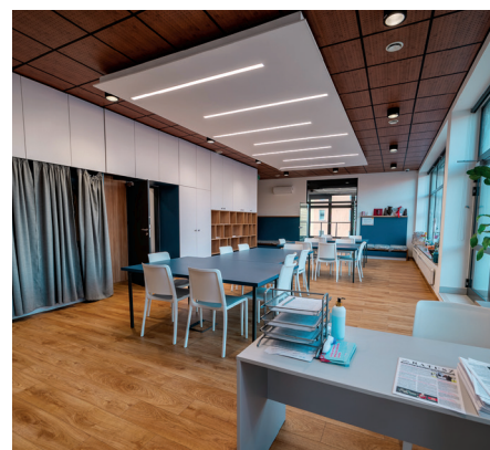
Sala sąsiedzka w Przystani Opata Hackiego 33