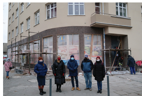
Pamiątkowe zdjęcie właścicieli i uczestników remontu.