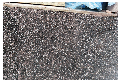
Fragment powierzchni tynku po zmyciu wierzchniej warstwy.