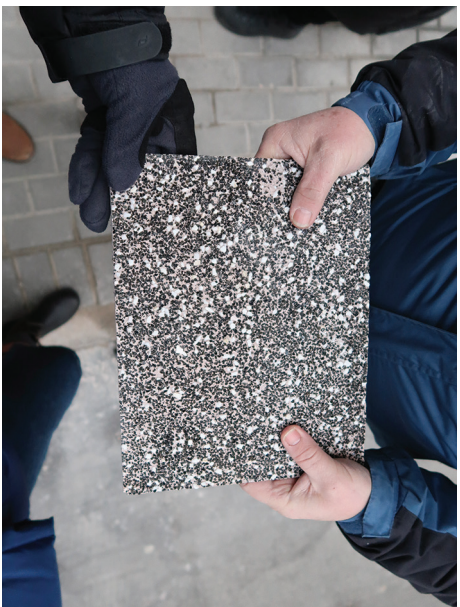
Próbka tynku zmywanego wykonana do zatwierdzenia.