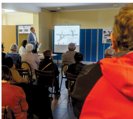
Spotkanie konsultacyjne ws. przebudowy skrzyżowań na Oksywiu górnym