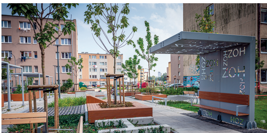
W roku 2020 rewitalizację osiedla Zamenhofs-Opata Hackiego na Chyloni z budową Przystani Opata Hackiego 33 nagrodzono w konkursie Modernizacja Roku

Sześć podobszarów, 65 zaplanowanych działań inwestycyjnych i społecznych, szeroka koalicja wydziałów Urzędu Miasta, jednostek miejskich, organizacji pozarządowych, partnerów społecznych, zaangażowanie mieszkańców. Za nami cztery lata zmian, jakie w gdyńskich dzielnicach dzieją się za sprawą rewitalizacji.