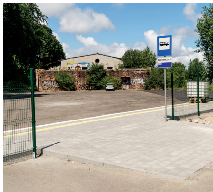
Przy plaży, dla wygody odpoczywających, powstała pętla autobusowa

Od lipca 2018 roku korzystać można z wygodnego dostępu do plaży: przedłużeniem ulicy Zielonej, na terenie udostępnionym przez Agencję Mienia Wojskowego. Wzdłuż zmodernizowanej drogi biegną chodniki. Na końcu ulicy Zielonej, zaraz przy wejściu na plażę, znajduje się nowa pętla autobusowa. Są też miejsca do pozostawienia rowerów. Odwiedzający Babie Doły samochodem mogą natomiast zaparkować pojazd na parkingu oddalonym o ok. 100 metrów od kąpieliska.