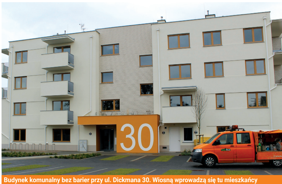
Budynek komunalny bez barier przy ul. Dickmana 30. Wiosną wprowadzą się tu mieszkańcy

Przy ul. Dickmana gotowy jest już gdyński budynek komunalny bez barier. Trwają odbiory, jeszcze wiosną wprowadzą się tu mieszkańcy. Decyzja o powstaniu bloku zapadła, gdy po analizie stanu technicznego parterowych budynków przy ul. Dickmana okazało się, że ich stan wyklucza poważne remonty czy przebudowy, co planowano