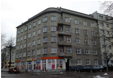
Widok kamienicy przed remontem.