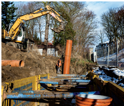
Na Oksywiu górnym trwa przebudowa ul. Makowskiego