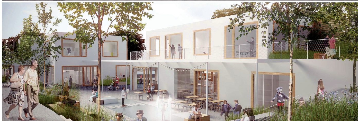
Przystan Widna 2A: w tworzących spójną całość dwóch dwukondygnacyjnych budynków działać będą dom sąsiedzki oraz filia Biblioteki Gdynia

P odpisanie umowy z wykonawcą na budowę Przystani Widna 2A, oddanie do użytku boiska przy SP nr 35, zakończenie konsultacji w sprawie zmian na ulicy Nauczycielskiej oraz rozpoczęcie takiego samego procesu w sprawie przebudowy terenu pomiędzy ulicami Widną, Nauczycielską i Uczniowską. Oto najważniejsze przedsięwzięcia, jakie w ramach rewitalizacji części Witomina podjęto w ostatnim czasie.