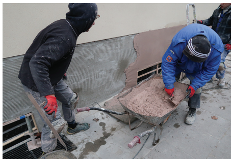
Zespołowe wykonywanie tradycyjnego tynku na cokole – ręczne narzucanie tynku na elewację.