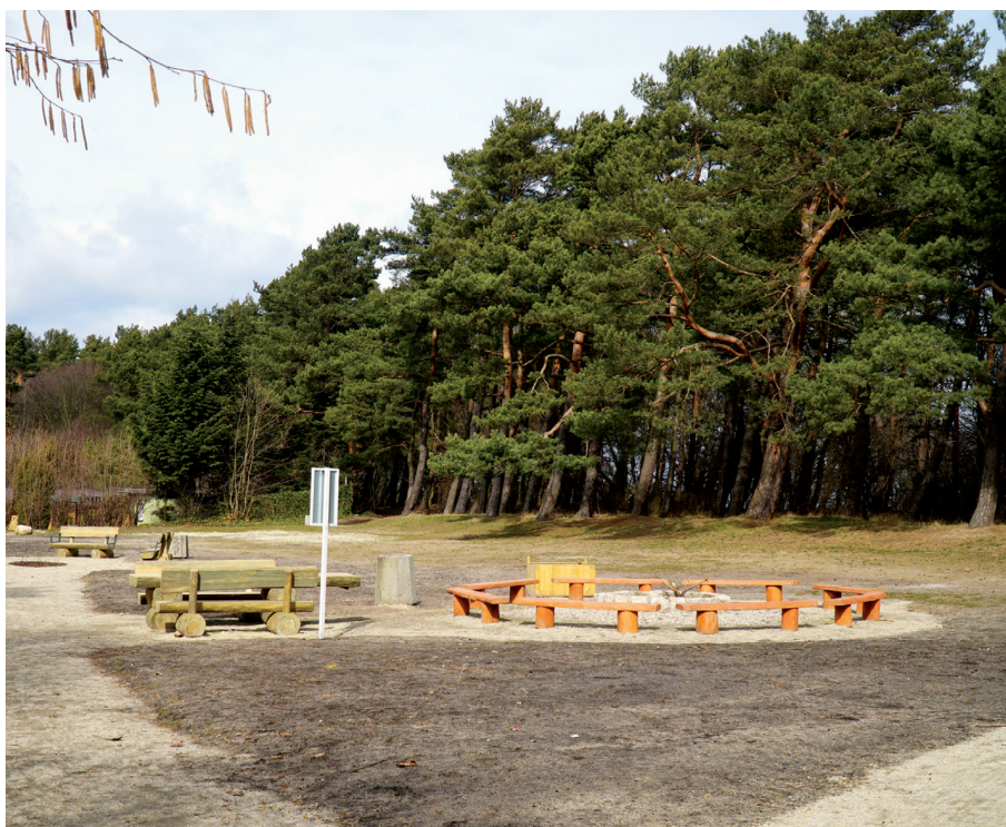
Popularna wśród mieszkańców polana rekreacyjna została zagospodarowana w roku 2020. Wcześniej mieszkańcy brali udział w konsultacjach.