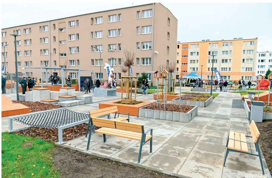
Inwestycja na osiedlu ZOH obejmowała m.in. zagospodarowanie przestrzeni wspólnych i termomodernizację bloków

doprowadzono ciepłą wodę. Poza poprawą estetyki, największą korzyścią remontów jest zmniejszenie kosztów ogrzewania w sezonie zimowym. W drugiej połowie 2018 roku podpisano umowę z wykonawcą drugiej części prac – i wkrótce po tym rozpoczęły się zmiany wewnątrz osiedla. Teren uzbrojono w kanalizację deszczową, by uzupełnić tę, która powstała w pierwszym etapie inwestycji. Przebudowano ulicę Zamenhofa: powstały nowe, oświetlone dojazdy do budynków oraz przyblokowe parkingi. Przez środek osiedla poprowadzono oświetloną aleję z przestrzeniami rekreacyjnymi i placami zabaw. Urządzono trawniki, nasadzono nową roślinność, ustawiono elementy małej architektury. Pojawiły się domki dla owadów oraz karmniki i poidełka dla ptaków. Trzem wspólnotom mieszkaniowym – Opata Hackiego 29, Opata Hackiego 23 oraz Zamenhofa 1 przydzielono dotacje na remonty części wspólnych. Równoległe do działań gminy, wspólnota Opata Hackiego 27 z własnych środków odnowiła elewację budynku.