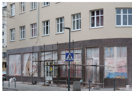
Fragment elewacji parteru z wykonanym tynkiem zmywanym.