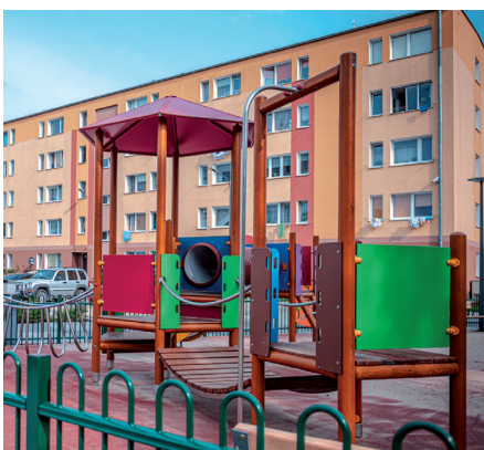
Jeden z placów zabaw dla najmłodszych mieszkańców

Przedstawiciele wszystkich wspólnot uczestniczyli w ustaleniach dotyczących np. lokalizacji stojaków rowerowych przy blokach czy zakresu wycinek zieleni na terenach przyblokowych. Współpraca dotyczyła - i będzie dotyczyć w przyszłości - także wieżowców. Rewitalizacja osiedla Zamenhofa-Opata Hackiego to szereg działań społecznych, stwarzających mieszkańcom zupełnie nowe możliwości spotkań, nawiązywania relacji i wspólnego, ciekawego spędzania czasu. Warto przypomnieć, że swoje akcje przeprowadził tu Teatr Gdynia Główna: parady w ramach projektu „ReAktywacja” czy prezentacja fragmentów „Cesarza” Ryszarda Kapuścińskiego w ramach „Ulicy Mistrzów”. W maju 2019 otwarto centrum sąsiedzkie Przystań Opata Hackiego 33 wraz z nowoczesną Biblioteką Chylonia. Dziś, z powodów pandemicznych, działania sąsiedzkie prowadzone są online. Co ważne, w tym trudnym czasie mieszkańcy obszaru rewitalizacji mogą korzystać z bezpłatnego wsparcia psychoterapeutki i pedagoga pracujących w Przystani. Szczegóły – na ostatniej stronie.