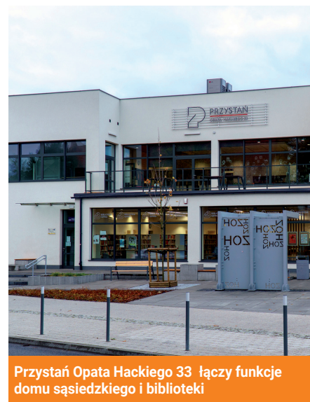
Przystanek Opata Hackiego 33 łączy funkcje domu sąsiedzkiego i biblioteki

Ponad tyle były posadzone na osiedlu ZOH