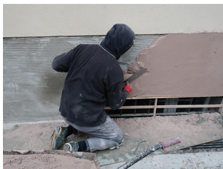
Wstępne wygładzanie powierzchni tynku.