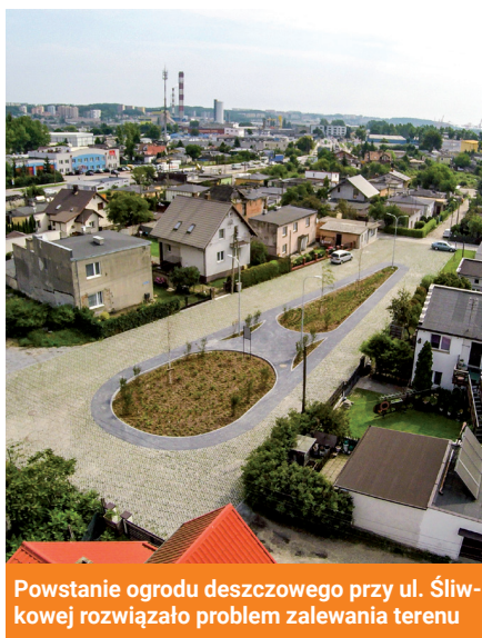
Powstanie ogrodu deszczowego przy ul. Śliwkowej rozwiązało problem zalewania terenu

kanalizacja deszczowa. Dzięki połączeniu z istniejącą siecią w ul. Przemysłowej, mieszkańcy posesji w rejonie Nowodworskiego 63 nie będą się już musieli martwić o to, czy po większych opadach ich domy zostaną zalane wodami spływającymi ulicą. Miasto przygotowuje się do przeprowadzenia inwestycji między innymi poprzez prace nad wyborem wykonawcy robót. Inwestycja będzie mogła rozpocząć się jednak dopiero po uzyskaniu prawomocnego zezwolenia na realizację inwestycji drogowej (ZRID), które jest obecnie procedowane. W ramach przeprowadzonych już na osiedlu Meksyk prac rewitalizacyjnych zbudowano ogród deszczowy przy ul. Śliwkowej, utwardzono ul. Palmową, uporządkowano numery adresowe, zorganizowano kina plenerowe, spektakle teatralne, spotkania konsultacyjne dotyczące m.in. planowanych zmian w organizacji ruchu, czy Fundusz Sąsiedzki.