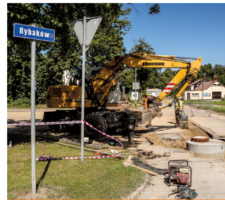
Sieć kanalizacyjna w ul. Rybaków powstała już w roku 2018