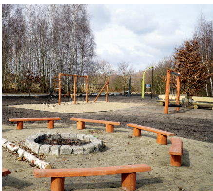
Polana rekreacyjna: tu można nie tylko odpocząć, ale i poćwiczyć