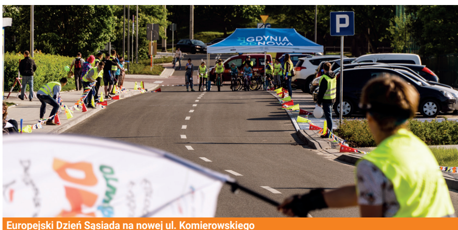
Europejski Dzień Sąsiada na nowej ul. Komierowskiego

Projekt Gdynia odNowa: Rewitalizacja obszaru Zamenhofa-Opata Hackiego jest współfinansowany ze środków Europejskiego Funduszu Rozwoju Regionalnego w ramach Regionalnego Programu Operacyjnego Województwa Pomorskiego na lata 2014-2020.