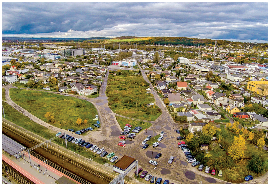
O to, by osiedle Meksyk zostało objęte Gminnym Programem Rewitalizacji, zabiegali sami mieszkańcy

P rzebudowa układu drogowego na osiedlu Meksyk na Chyloni to jedno z najważniejszych działań w tej okolicy w ramach rewitalizacji. O tę inwestycję zabiegali sami mieszkańcy, a projekt był z nimi omawiany.