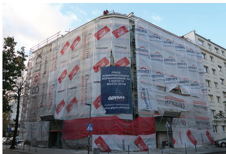
Kamienica w trakcie prac restauratorskich.