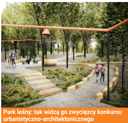
Park leśny: tak widzą go zwycięzcy konkursu urbanistyczno-architektonicznego

w GPR. Władze Gdyni zdecydowały o wyburzeniu budynków, przyznaniu ich lokatorom mieszkań z zasobów gminy i budowie na części opuszczonego terenu komunalnego bloku bez barier. Od początku myśłano o nim jako o budynku wielopokoleniowym, w którym zawiąże się wspólnota mieszkańców – i będzie przyciągać innych mieszkańców Oksywia. W budynku zaplanowano świetlicę, a za nim teren, którego docelowo kształt ma zostać zaprojektowany z mieszkańcami.