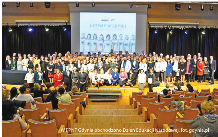
W PPNT Gdynia obchodzono Dzień Edukacji Narodowej, fot. gdynia.pl

Pełna lista osób odznaczonych i nagrodzonych znajduje się na str. 9 „Ratusza”.