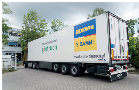
Jeden z transportów do Zytomierza