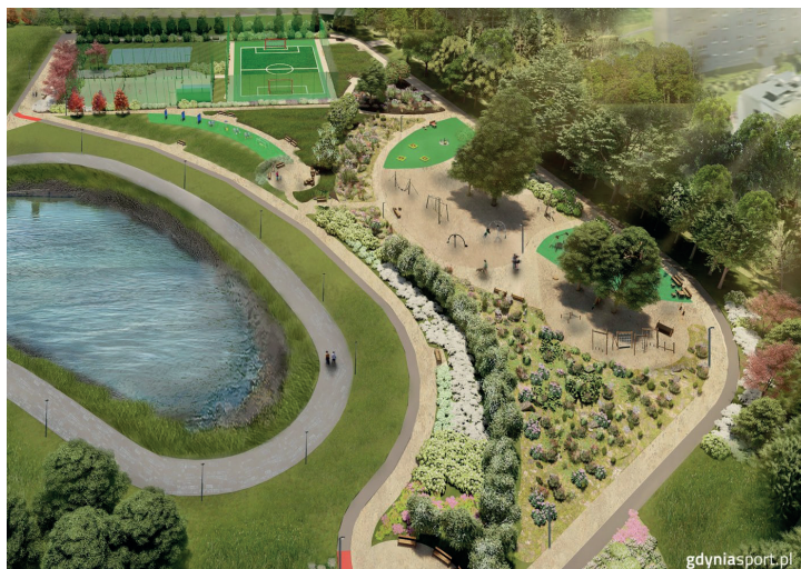
Inwestycja zakłada metamorfozę obecnie niezagospodarowanego obszaru (wizualizacja Gdynińskiego Centrum Sportu)

Wielomilionowe inwestycje przyczyniają się do znaczącej transformacji krajobrazu dzielnicy, zmieniając jej oblicze i tworząc