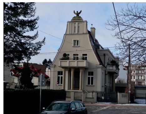
Budynek mieszkalny „Willa Gryf”, ul. Przemysława 6, nr w rejestrze zabytków 1037, dotacja na wykonanie izolacji ścian podziemia,