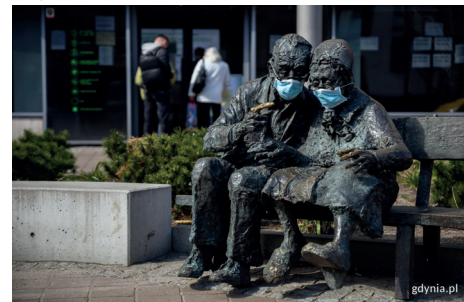
Para Kaszubów w maskach, fot. Przemysław Kozłowski

mości gminne czy starać się o odroczenie opłat za użytkowanie wieczyste. Działania związane z pandemią pochłonęły ponad 72 mln złotych, w tym z budżetu miasta ponad 14,5 mln zł.