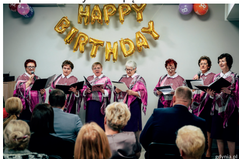
Ósme urodziny Miejskiego Klubu Seniora „Północ” w Przystani Śmidowicza 49

Trwają prace na terenie Centrum Nowoczesnego Seniora przy ul. 10 Lutego. Za 17 mln zł powstaje miejsce, gdzie już w przyszłym roku seniorzy będą mogli uczestniczyć w zajęciach, realizować swoje pomysły, wspólnie kreatywnie spędzać czas.