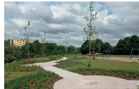
Kieszonka Kosmiczna