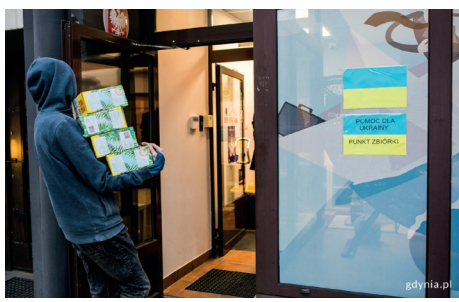
Punkt zbiórki darów w GCOP, fot. Karol Stańczyk