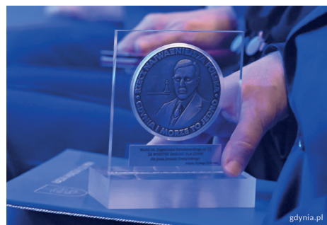
Medal im. Eugeniusza Kwiatkowskiego