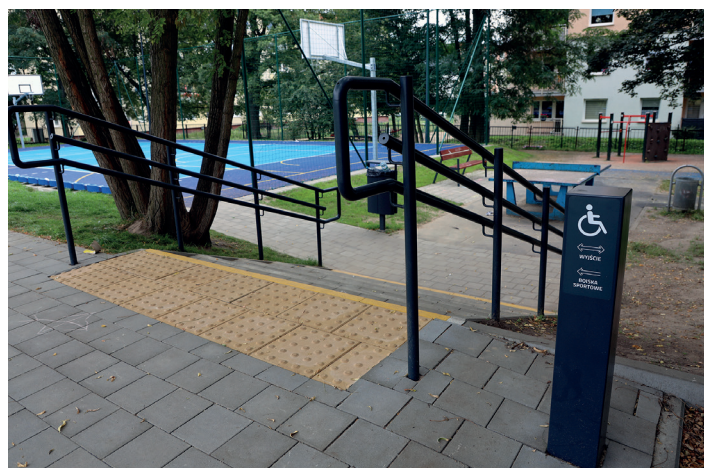
Nowe boiska i zagospodarowanie terenu przy Szkole Podstawowej nr 33 na Oksywiu

W szkołach i przedszkolach realizowanych jest wiele sztandarowych gdyńskich programów, m.in. „Gdynia na fali”, „Rowerowy Maj”, „Odprawdam sam”, czy „Wgraj się”, gdzie młodzi trenują pod okiem trenerów gdyńskich klubów sportowych, a nawet ich zawodników. Realizowane także będą aktywności np. w ramach Erasmus+ . Gdyński samorząd finansuje także wymiany międzynarodowe , dzięki którym uczniowie nie tylko rozwijają zdolności językowe ale i poszerzają horyzonty. Młodzież ze szkół ponadpodstawowych może brać udział w konkursie „Gdynia Business Week”, gdzie nagrodą jest udział w edycji amerykańskiej „Washington Business Week”.