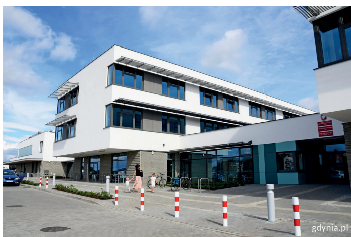
Nowa szkoła na Chwarznie-Wiczlinie, fot. Kamil Zloch

Współczynnik zmianowości w roku szkolnym 2023/2024 w gdyńskich podstawówkach wyniósł 0,93, a w szkołach ponadpodstawowych nie przekroczył 0,80. W 15 szkołach prowadzone są zajęcia sportowe (49 klasach sportowych w 10 dyscyplinach sportowych). Akcje „Lato” i „Zima” w Gdyni finansowane są ze środków miasta. W latach 2018-2022 samorząd przeznaczył na ten cel ponad 1,3 mln zł, a w 2024 r. ponad 460 tys. zł. W 2023 r. zajęcia były finansowane w ramach środków UNICEF. Lata 2018-2023 to także realizacja 17 programów edukacyjnych dotyczących m.in. bezpieczeństwa dzieci i młodzieży w internecie, wsparcie dzieci i młodzieży uzdolnionej, wsparcie szkolnictwa zawodowego, w tym dostosowanie procesu kształcenia do potrzeb rynku pracy. Przeznaczono na ten cel ponad 95 mln złotych z budżetu miasta, przy współfinansowaniu unijnym i rządowym.