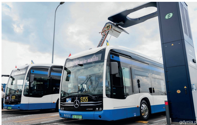
Nowe, elektryczne autobusy kursują już po Gdyni

• Powstał kontrapas na ul. Chwarznieńskiej.