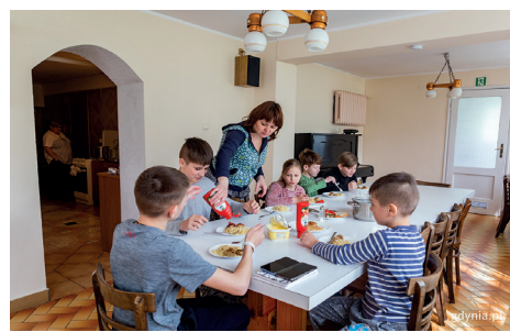
Dom dla kobiet z dziećmi u siostr elżbietanek w Orłowie, fot. Przemysław Kozłowski