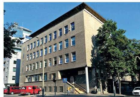
Budynek YMCA przy ul. Żeromskiego 26, pocz. lat 50. XX w., elewacja wykończona szarymi ceglami cementowymi