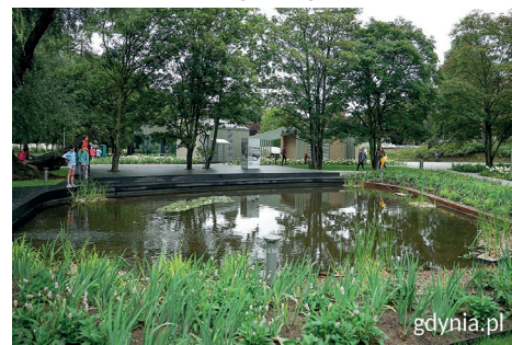
Ukryty w cieniu drzew biologiczny staw w Parku Centralnym zaprasza ptaki, owady i płazy