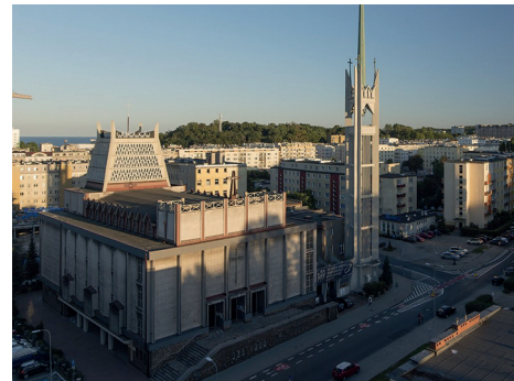
Kościół pw. Najświętszego Serca Pana Jezusa przy ul. Armii Krajowej 46 w Gdyni, fot. Bartłomiej Ponikiewski