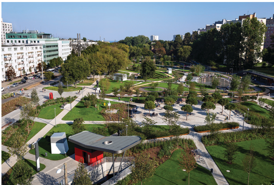
Park Centralny