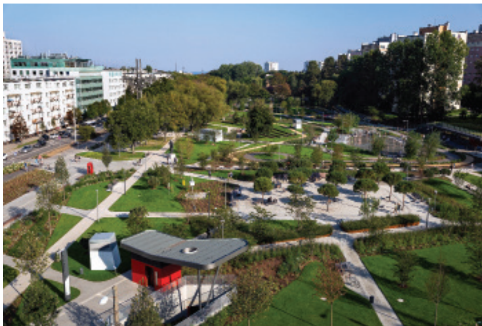
Park Centralny