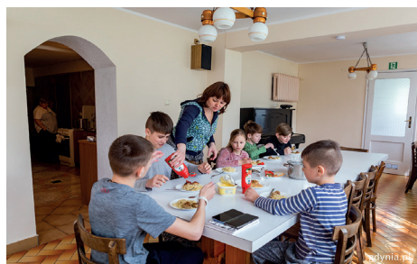
Dom dla kobiet z dziećmi u sióstr elżbietanek w Orłowiu