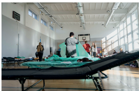
Jedno z miejsc zbiorowego zakwaterowania uchodźców, fot. Kamil Złoch