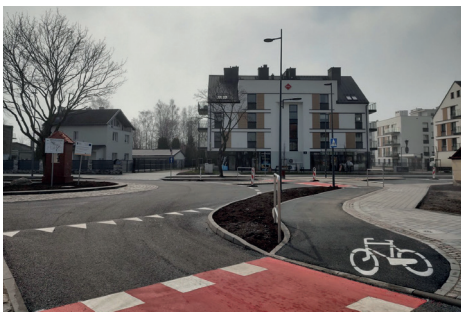
Rozbudowane skrzyżowanie ul. Bosmańska – Plk. Dąbka – Dickmana, mat. Laboratorium Innowacji Społecznych

W mijającej kadencji zrealizowano m.in. budowę budynku komunalnego na Oksywiu, utworzono trakt leśny na Oksywiu, przebudowano układ drogowy wraz z budową pętli autobusowej na osiedlu Meksyk. To tylko niektóre ze spektakularnych zmian jakie zaszły na przestrzeni ostatnich lat. Program rewitalizacji to blisko 126 mln złotych środków gminnych, prywatnych (budżety wspólnot mieszkaniowych) i pozyskanych przez miasto środków unijnych. Program rewitalizacji, to szereg działań społecznych mających na celu rozwój usług społecznych w dzielnicach, nakierowanych na wsparcie psychologiczne osób w kryzysach, działania z młodzieżą i wsparcie lokalnej społeczności. Wśród szeregu projektów społecznych realizowanych przez LIS i wspierających proces rewitalizacji, znalazła się PRACOWNIA – system aktywizacji społeczno-zawodowej. Wsparciem objęto 698 osób. Dla 279 gdynian i gdynianek zakończył się okres wykluczenia i rozpoczął nowy etap życia po podjęciu pracy.