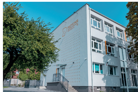
Przystań Śmidowicza 49

W Przystaniach łączą się działania m.in. z zakresu pomocy społecznej, rynku pracy, edukacji, integracji, kultury, sportu, aktywności wspierającej rozwój międzykulturowości oraz obywatelskości. W zależności od lokalizacji i potrzeb, w Przystaniach działają kluby seniora, biblioteki, dzielnicowe ośrodki pomocy społecznej, placówki wsparcia dziennego, realizowane są funkcje kulturalne, zdrowotne, sportowo-rekreacyjne, edukacyjne, integracji społecznej i kulturowej. W każdej Przystani zaplanowano dom sąsiedzki - miejsce rozwoju zainteresowań i realizacji pomysłów mieszkańców, spędzania wolnego czasu, powstawania oddolnych, samodzielných i niezależnych inicjatyw. Domy Sąsiedzkie są otwarte na wszystkich.