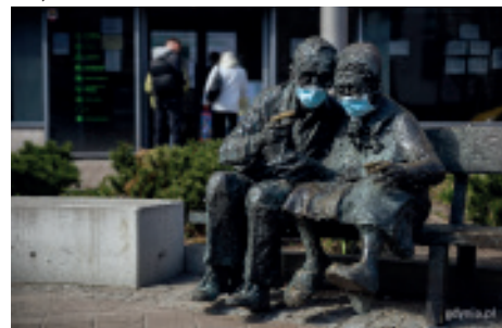
Para Kaszubów w maskach

mości gminne czy starać się o odroczenie opłat za użytkowanie wieczyste. Działania związane z pandemią pochłonęły ponad 72 mln złotych, w tym z budżetu miasta ponad 14,5 mln zł.