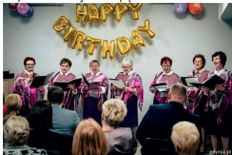
Ośme urodziny Miejskiego Klubu Seniora „Północ” w Przystani Śmidowicza 49

Trwają prace na terenie Centrum Nowoczesnego Seniora przy ul. 10 Lutego. Za 17 mln zł powstaje miejsce, gdzie już w przyszłym roku seniorzy będą mogli uczestniczyć w zajęciach, realizować swoje pomysły, wspólnie kreatywnie spędzać czas.