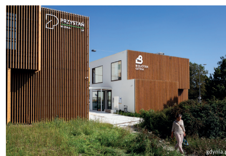
W samym centrum Witomina działa Biblioteka Witomino

Warto wspomnieć, że współpraca miasta z NGO-sami w zakresie kultury owocuje szeregiem atrakcyjnych wydarzeń, w których gdynianki i gdynianie chętnie uczestniczą. Granty na te projekty z kasy miejskiej to ponad 2,6 mln zł w latach 2020-2023.