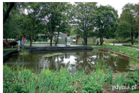
Ukryty w cieniu drzew biologiczny staw w Parku Centralnym zaprasza ptaki, owady i plaży