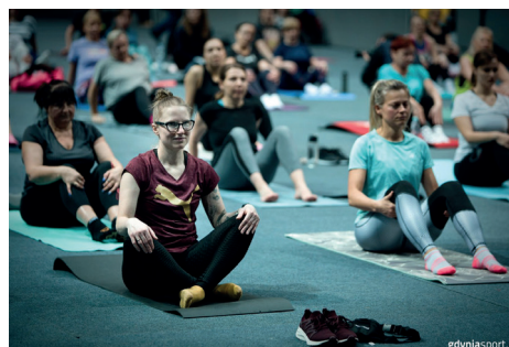
Program Gdyńskie Poruszenie ma 10 lat

Warto dodać, że z powodzeniem, od 10 już lat realizowany jest program Gdyńskiego Poruszenia. Dziś Gdyńskie Poruszenie to 13 różnych aktywności – Dziecko i jego świat, Fitness, Indoor Cycling, Joga, Joga dla seniora, Joga Śmiechu, Odetchnij w Gdyni (Nordic Walking), Pilates, Pilates dla seniora, Zajęcia dla kobiet w ciąży, Zajęcia dla osób z niepełnosprawnościami ruchowymi, Zdrowy kręgosłup, Zumba, Zumba dla seniora i parkrun. Aktywności odbywają się w kilku dzielnicach. Są bezpłatne.