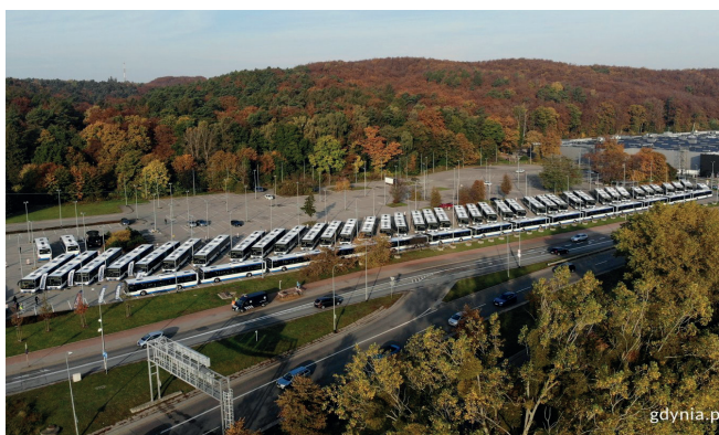
55 nowoczesnych i ekologicznych autobusów trafiło do Gdyni, fot. Michał Puszczewicz