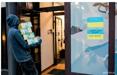
Punkt zbiórki darów w GCOP