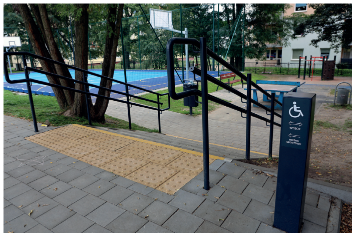
Nowe boiska i zagospodarowanie terenu przy Szkole Podstawowej nr 33 na Oksywiu, fot. Michał Kozłowski

W szkołach i przedszkolach realizowanych jest wiele sztandarowych gdyńskich programów, m.in. „Gdynia na fali”, „Rowerowy Maj”, „Odprowadzam sam”, czy „Wgraj się”, gdzie młodzi trenują pod okiem trenerów gdyńskich klubów sportowych, a nawet ich zawodników. Realizowane także będą aktywności np. w ramach Erasmus+ . Gdyński samorząd finansuje także wymiany międzynarodowe , dzięki którym uczniowie nie tylko rozwijają zdolności językowe ale i poszerzają horyzonty. Młodzież ze szkół ponadpodstawowych może brać udział w konkursie „Gdynia Business Week”, gdzie nagrodą jest udział w edycji amerykańskiej „Washington Business Week”.