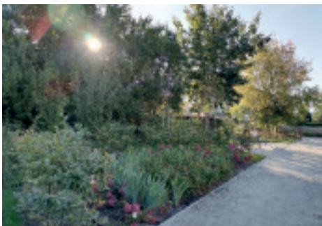
Stacja „Kieszonka”

W 2022 r. z najcenniejszych drzew w Gdyni zostało utworzonych 68 nowych pomników przyrody, a w 2023 r. kolejne 8. Łącznie ochroną pomnikową zostało objęte 76 drzewa.