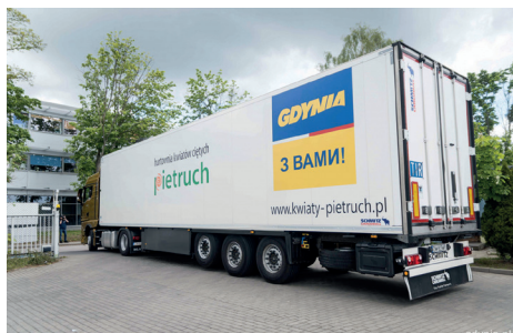
Jeden z transportów do Żytomierza, fot. Kamil Złoch