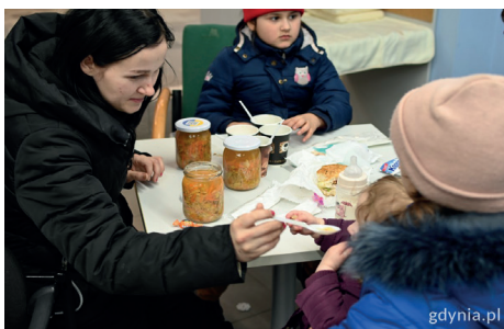
Pośilki dowożone przez gdynskich restauratorów do punktu informacji