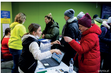
Punkt informacji na dworcu PKP Gdynia Główna, fot. Przemysław Kozłowski

• 2300 uczniów z Ukrainy uczyło się w gdynskich szkołach w ubiegłym roku szkolnym, w obecnym jest ich 1940.