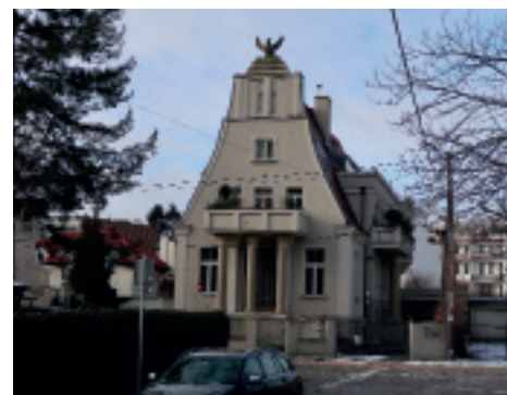
Budynek mieszkalny „Willa Gryf” , ul. Przemysława 6, nr w rejestrze zabytków 1037, dotacja na wykonanie izolacji ścian podziemia, fot. materiały Biura Miejskiego Konserwatora Zabytków w Gdyni