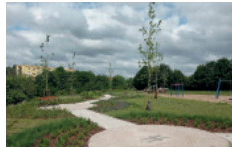
Kieszonka Kosmiczna, fot. Wydział Ogrodnika Miasta Gdyni