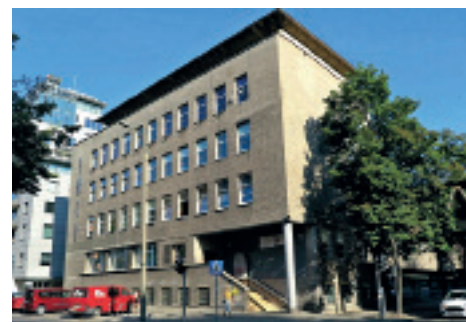
Budynek YMCA przy ul. Żeromskiego 26, pocz. lat 50. XX w., elewacja wykończona szarymi ceglami cementowymi

Węzeł Chylonia. Ponad 5700 metrów kwadratowych nowych chodników, ponad 800 metrów kwadratowych dróg dla rowerów i ponad 1000 metrów kwadratowych nowej nawierzchni. Teren węzła integracyjnego oświetla na zewnątrz 46 nowoczesnych lamp LED, a na parkingu podziemnym – 170 lamp. Parking podziemny to 140 miejsc dla samochodów. Koszt inwestycji to ponad 88 mln zł. (w tym fundusze UE).