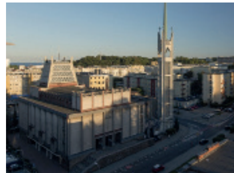
Kościół pw. Najświętszego Serca Pana Jezusa przy ul. Armii Krajowej 46 w Gdyni