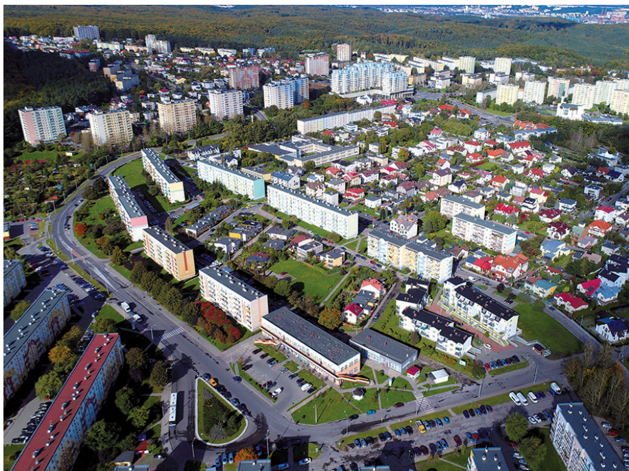
Witomino-Leśniczówka z lotu ptaka

W itomino-Leśniczówka... Już sama nazwa dzielnicy przywołuje na myśl skojarzenia bliskie każdemu miłośnikowi przyrody, spragnionemu ciszy, bliskości natury, czystego powietrza czy zapachu lasu. I taka właśnie jest gdyńska Leśniczówka na Witominie.