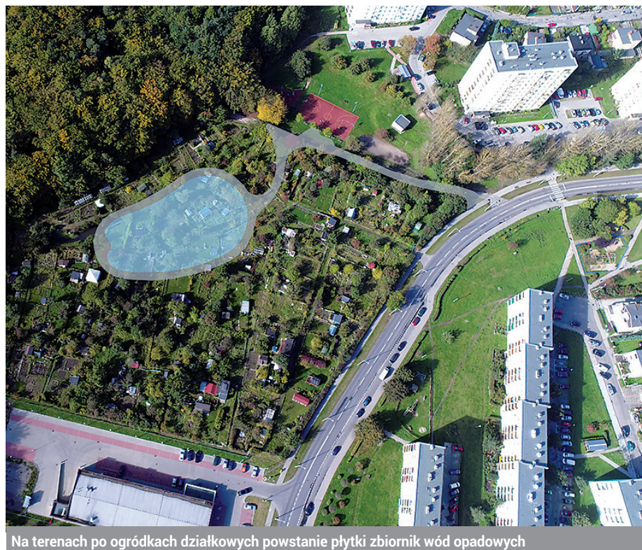
Na terenach po ogródkach działkowych powstanie płytki zbiornik wód opadowych

W sąsiedztwie, po drugiej stronie ul. Chwarznińskiej, będą wkrótce realizowane szerokie inwestycje w ramach rewitalizacji zachodniej części Witomina-Radiostacji. Poprawi się jakość przestrzeni publicznej, powstanie nowa infrastruktura sportowa. Zbudowane zostanie centrum sąsiedzkie z nowoczesną biblioteką i innymi usługami społecznymi. Żłobek przy ul. Uczniowskiej powiększy się o 78 dodatkowych miejsc. To z pewnością dobra wiadomość dla młodych rodziców z naszej dzielnicy.