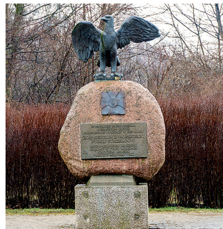
Pomnik poświęcony 2. MPS stoi w Kolibkach