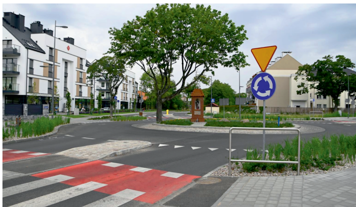
Przebudowane skrzyżowanie: Dąbka, Bosmańska, Dickmana