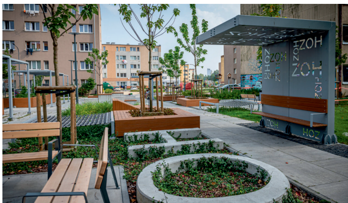
Zagospodarowana przestrzeń osiedla Zamenhofa-Opata Hackiego