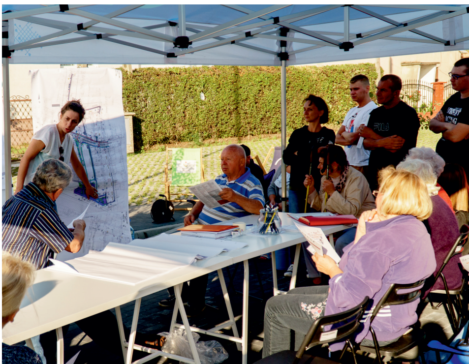
Konsultacje z mieszkańcami na Meksyku