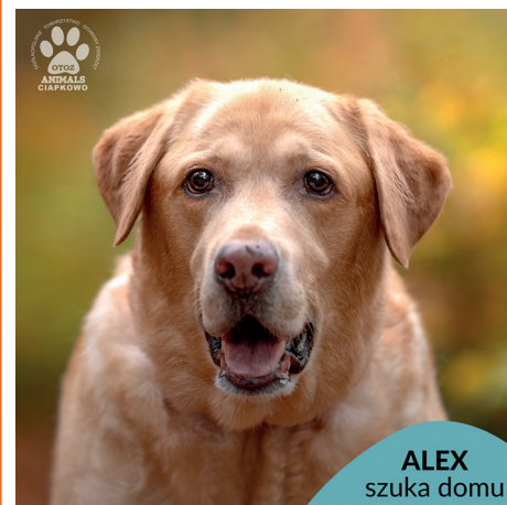
ALEX szuka domu

Kontynuujemy rubrykę, dzięki której, mamy nadzieję, kolejne porzucone psy i koty ze schroniska w „Ciapkowie” znajdą ciepły dom.