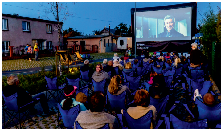
Kino plenerowe na Meksyku

Działania rewitalizacyjne w Gdyni zapoczątkowane zostały w 2008 r. na osiedlu Zamenhofa-Opata Hackiego. Od 2017 r. prowadzone są na 6 podobszarach, których granice zostały ustalone w 2016 r. przez Radę Miasta Gdyni w tzw. uchwale delimitacyjnej. Dla tych obszarów w 2017 r. uchwalono Gminny Program Rewitalizacji miasta Gdyni na lata 2017-2026 (GPR). Jego obecna aktualizacja dotyczy nadal tych samych terenów.