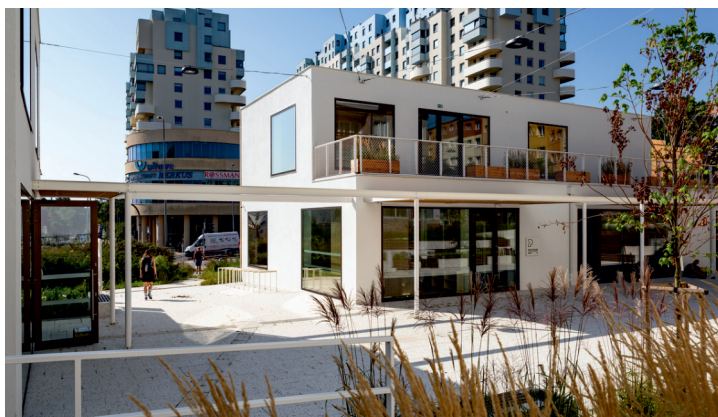
Centrum Sąsiedzkie Przystań Widna 2A