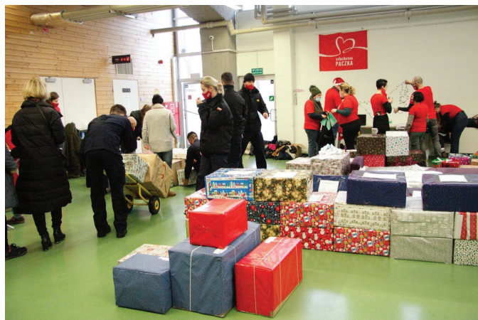
Magazyn z darami w PPNT Gdynia//mat. pras. Szlachetnej Paczki

Szczegóły na stronie internetowej Szlachetnej Paczki.