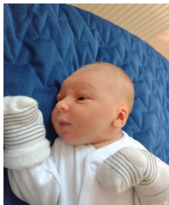
Gabriel, 7.12, 58 cm, 3600 g