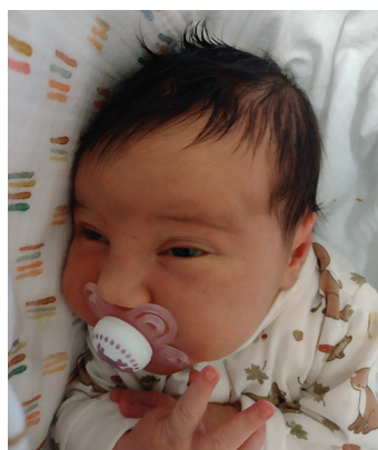
Lili, 6.12, 58 cm, 4006 g