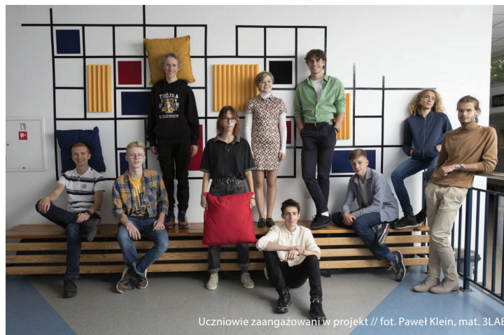
Uczniowie zaangażowani w projekt

Przypomnijmy, że twórcy Pracowni 3LAB zostali m.in. finalistami