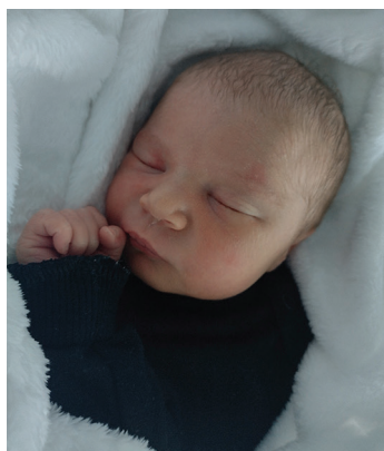
Pola, 8.12, 52 cm, 3080 g