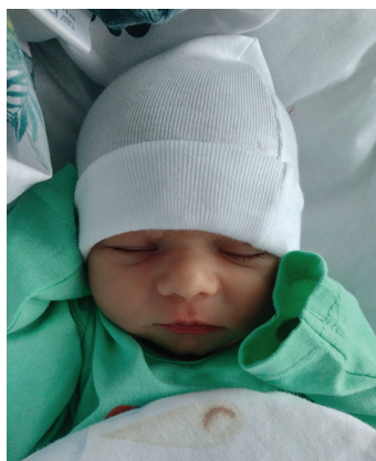
Antonina, 8.12, 52 cm, 2880 g