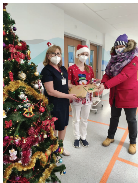
Tegoroczna akcja „BiblioMikołaje”