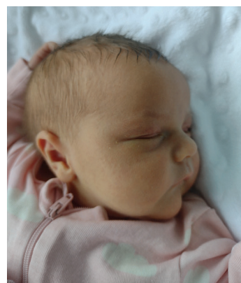
Maja, 7.12, 53 cm, 3760 g