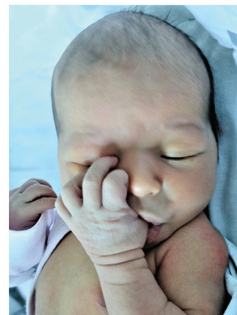
Hanna , 8.11.22, 53 cm, 3140 g