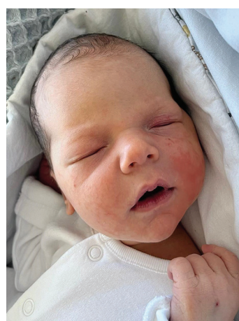
Leopold , 2.11.22, 57 cm, 3490 g