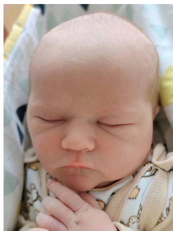
Jan , 3.11.22, 51 cm, 3880 g