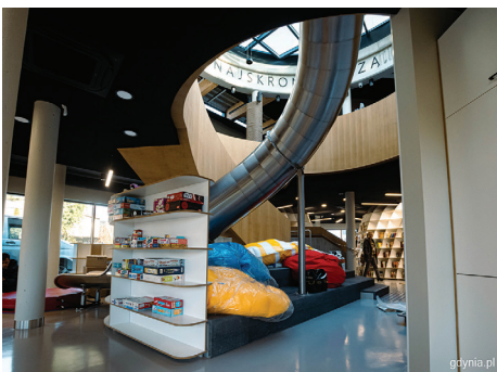
Przeźren łącząca funkcje biblioteki i przystani sąsiedzkiej, fot. Kamil Złoch

Łączna powierzchnia użytkowa na obu kondygnacjach to ponad 400 metrów kwa-