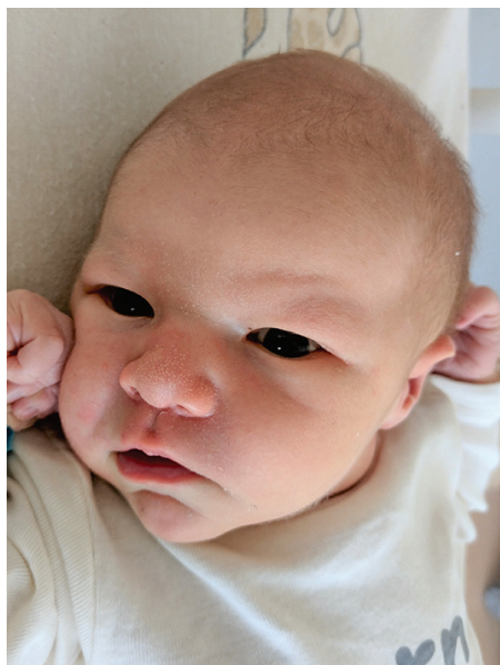
Kornel , 59 cm, 4030 g, 20.08