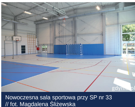
Nowoczesna sala sportowa przy SP nr 33

Cztery inwestycje są w trakcie postępowania przetargowego. Chodzi o: budowę obiektów sportowych wraz z niezbędną infrastrukturą na terenie Szkoły Podstawowej nr 44 ; remont boiska przy ul. Wójta Radtkego oraz przebudowę terenów uszczelnionych przy Zespole Szkół Ogólnokształcących nr 6 .