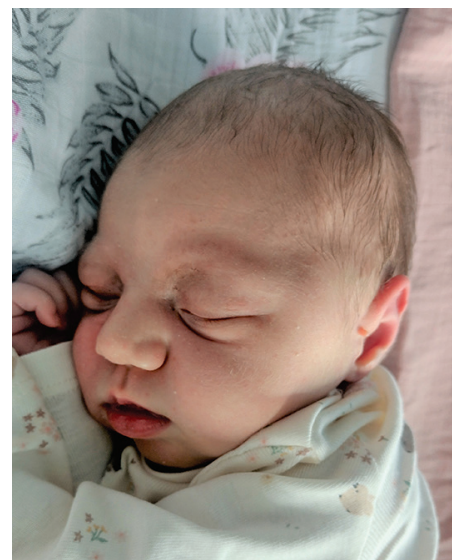
Milena , 55 cm, 3400 g, 18.08