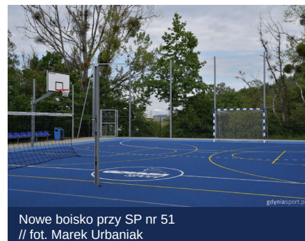
Nowe boisko przy SP nr 51