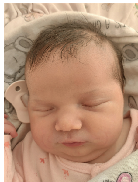
Lilianna , 54 cm, 3620 g, 17.08