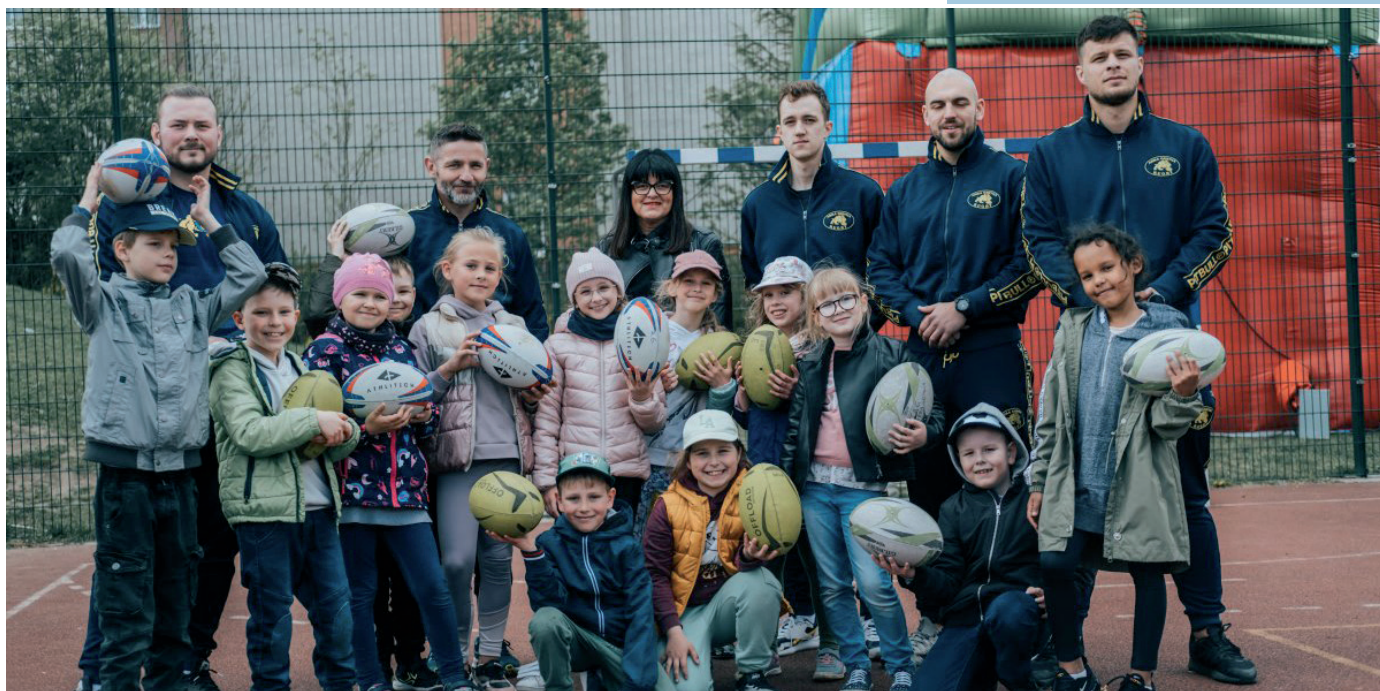
Realizacja projektu „Wgraj się!”

Muzeum Miasta Gdyni oprócz tradycyjnej oferty – warsztatów czy oprowadzania wprowadza nowości. Pierwszą propozycją jest biwakowanie i nocowanie, organizowane wspólnie z ogrodem botanicznym w Marszewie. W październiku odbędzie się szkolenie dla nauczycieli „Jak używać lasu”, również w Marszewie. Przeprowadzą go specjaliści z zakresu wiedzy o Trójmiejskim Parku Krajobrazowym. Z całym zakresem warsztatów można zapoznać się w zakładce edukacja na stronie muzeumgdynia.pl .