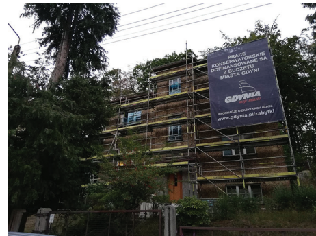
Budynek mieszkalny, ul. Olsztyńska 28

– Budynek mieszkalny, ul. Morska 150, dotacja na renowację tynków szlachetnych elewacji frontowej, w wysokości do 30 456,00 zł oraz dotacja na pozostałe prace remontowe elewacji frontowej w wysokości do 28 008,60 zł.