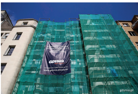
W budynku przy ul. 10 Lutego 29 jest odnawiana tylna elewacja

znaczono na remont kominów i wymianę orynnowania poziomego;