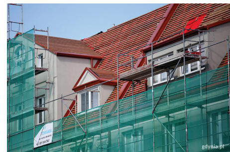
Budynek mieszkalny przy ul. płk. Dąbka 52