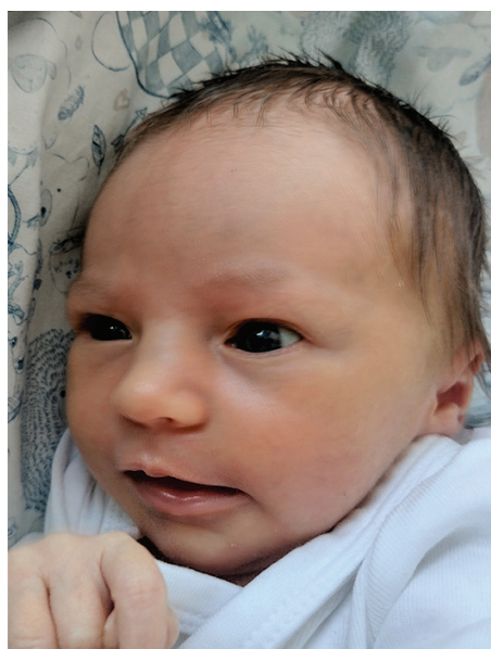
Lara , 50 cm, 2790 g, 20.08