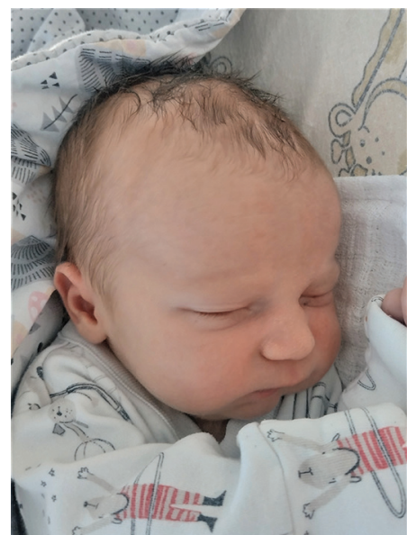
Synek , 56 cm, 3700 g, 17.08