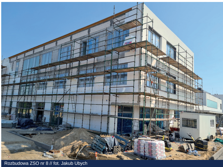
Rozbudowa ZSO nr 8

Trwają również przetargi, które wyłonią wykonawców kolejnych inwestycji.