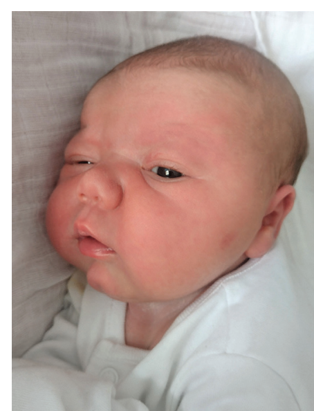
Victoria , 56 cm, 4080 g, 18.08