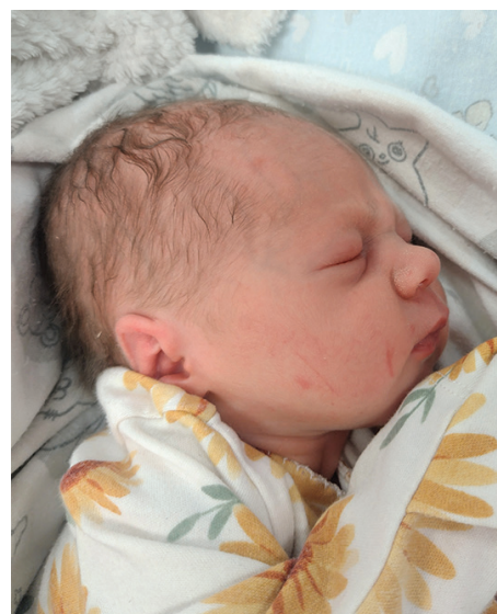
Nela , 51 cm, 2700 g, 19.08