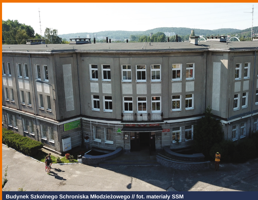
Budynek Szkolnego Schroniska Młodzieżowego // fot. materiały SSM

które przejdą pozytywnie rekrutację, naukę w klasie I gimnastyki artystycznej rozpoczną od 1 września 2021 roku. Część zajęć treningowych będzie się odbywać na sali gimnastycznej Szkoły Podstawowej nr 21 oraz profesjonalnie przygotowanej przestrzeni do gimnastyki artystycznej w Zespole Sportowych Szkół Ogólnokształcących przy ul. Władysława IV 54.