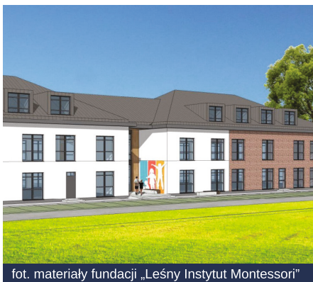
fot. materiały fundacji „Leśny Instytut Montessori”

oddziałów przedszkolnych dla młodszych dzieci. W dalszej przyszłości szkoła stanie się dla Gdyni i okolic swoistym centrum edukacji, informacji i pomocy dla uczniów, rodziców i nauczycieli – w zakresie wspierania dzieci w przełamywaniu różnego rodzaju trudności. Będzie też udzielać porad i wsparcia w dostosowywaniu przestrzeni wewnątrz budynków. Remont budynku zostanie sfinansowany przez GSS.