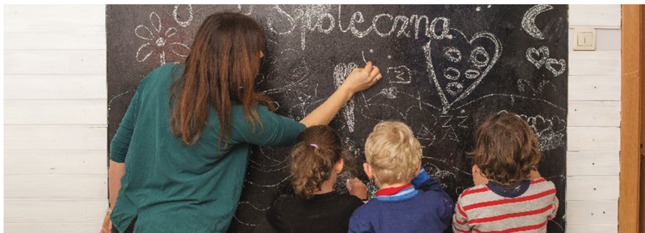
Zajęcia w Gdyńskiej Szkole Społecznej

Jak każdego roku, samorząd gdyński przygotowuje się do realizacji remontów placówek oświatowych. Na ten cel przeznaczony ponad 18 mln złotych czyli o 5 mln zł więcej niż w ubiegłym roku. Dzięki temu aż w 15 przedszkolach, 27 szkołach podstawowych i zespołach szkolno-przedszkolnych, 4 liceach i 4 szkołach zawodowych do końca 2021 r. zostaną przeprowadzone prace remontowe, modernizacyjne oraz inwestycyjne.