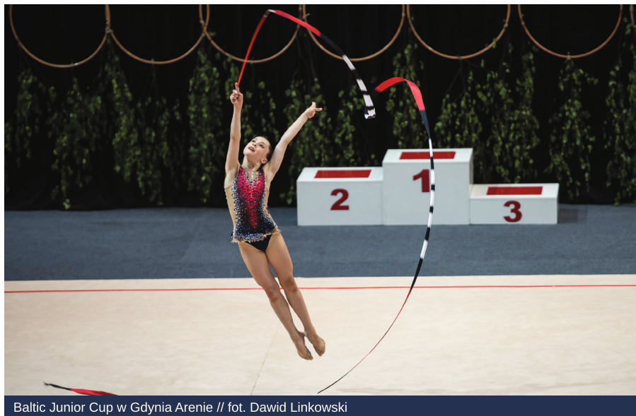
Baltic Junior Cup w Gdynia Arenie

Gdynia wzbogaci swoją ofertę edukacyjną o nowe możliwości dla uczniów, których wyjątkową pasją jest sport. Powstaje Niepubliczna Szkoła Mistrzostwa Sportowego. Placówka będzie dzielić przestrzeń budynku wraz z uczniami SP nr 52. Bezpieczne i niezależne kształcenie uczniów (zostaną wydzielone osobne części) na dwóch poziomach edukacji gwarantuje rozbudowana infrastruktura sportowa i konstrukcja budynku tej placówki. Szkołę będzie prowadziło Stowarzyszenie „In gremio”. 1 września 2021 roku naukę w Szkole Mistrzostwa Sportowego może rozpocząć nawet 250 uczniów – tyle miejsc zostanie przygotowanych dla młodych sportowców. Zajęcia sportowe będą odbywać się w dużej sali gimnastycznej Szkoły Podstawowej nr 52 oraz w nowo-budowanej hali sportowej przy II Liceum Ogólnokształcącym.