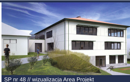
SP nr 48 // wizualizacja Area Projekt

Edukacja zawsze była i będzie najważniejszą gdyńską inwestycją. Wszyscy dobrze wiemy, jak wielki wpływ ma oświata na jakość życia oraz rozwój osobisty i zawodowy mieszkańców. Ponadprzeciętne wyniki uczniów są efektem pracy ich samych, ale również niezwyklej determinacji całej kadry szkolnej, jak i rodziców. Wspólnie dbamy o rozwój uczniów, przełamujemy stereotypy i budujemy ofertę edukacyjną bez barier. Dlatego nasze miasto jako miejsce zdobywania wiedzy wybiera coraz więcej młodych osób z całej Polski. Cieszę się, że rozwijając infrastrukturę możemy zapewnić dzieciom i młodzieży świetne warunki do nauki oraz motywować ich do rozwijania pasji i zainteresowań.