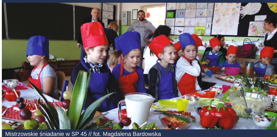
Mistrzowskie śniadanie w SP 45

Ponad 460 godzin dydaktycznych tygodniowo dla uczniów klas IV-VIII szkół podstawowych, blisko 100 godzin dla klas I szkół ponadpodstawowych – to bilans przyznanych przez gdyński samorząd „grantów” na dodatkową realizację wybranych zajęć edukacyjnych w placówkach. Gdynia nie przestaje konsekwentnie inwestować w rozwój uczniów, pomimo zmniejszenia udziału środków rządowych w finansowaniu oświaty, czyli tzw. subwencji oświatowej.