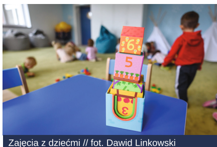
Zajęcia z dziećmi

W najbliższych tygodniach rozpoczną się prace projektowe i konkretne działania mające na celu przygotowanie budynku do nowych zadań, co zaplanowane jest jeszcze w roku szkolnym 2021/2022. Budynek szkoły będzie mieć zatem stopniowo zmieniający charakter usług edukacyjnych – z prowadzonej dotychczas funkcji szkoły podstawowej na rzecz wsparcia psychologicznego najmłodszych gdynian.