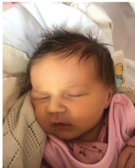
Rozalia , 3 maja 3350 g, 55cm