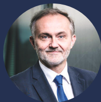
Wojciech Szczurek Prezydent Gdyni

Edukacja zawsze była i będzie najważniejszą gdyńską inwestycją. Wszyscy dobrze wiemy, jak wielki wpływ ma oświata na jakość życia oraz rozwój osobisty i zawodowy mieszkańców. Ponadprzeciętne wyniki uczniów są efektem pracy ich samych, ale również niezwyklej determinacji całej kadry szkolnej, jak i rodziców. Wspólnie dbamy o rozwój uczniów, przełamujemy stereotypy i budujemy ofertę edukacyjną bez barier. Dlatego nasze miasto jako miejsce zdobywania wiedzy wybiera coraz więcej młodych osób z całej Polski. Cieszę się, że rozwijając infrastrukturę możemy zapewnić dzieciom i młodzieży świetne warunki do nauki oraz motywować ich do rozwijania pasji i zainteresowań.