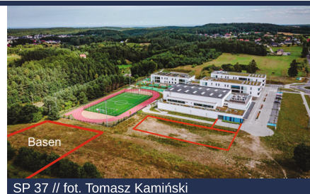
SP 37 // fot. Tomasz Kamiński

Koszt powyższych inwestycji to ok. 34 mln zł. Planowane zakończenie ich realizacji w roku szkolnym 2021/2022.