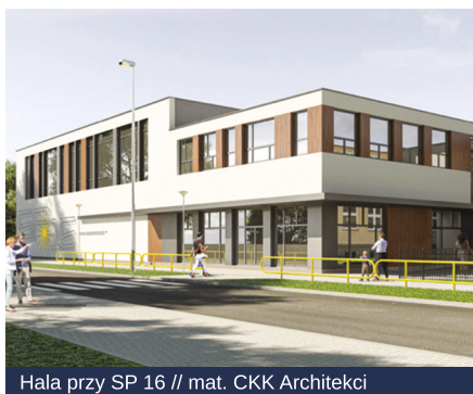
Hala przy SP 16 // mat. CKK Architekci

Powstają już trzy z pięciu niezwykle nowoczesnych hal sportowych, które będą służyć m.in. uczniom i nauczycielom Szkół Podstawowych nr 16, 33 oraz II Liceum Ogólnokształcącego. Planowane są również prace nad kolejnymi obiektami sportowymi – przy Szkole Podstawowej nr 20 i Zespole Szkół Hotelarsko-Gastronomicznych. Wszystkie zostaną wyposażone w nowoczesny sprzęt sportowy.