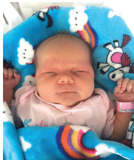
Pola , 3 maja 4460 g, 59 cm