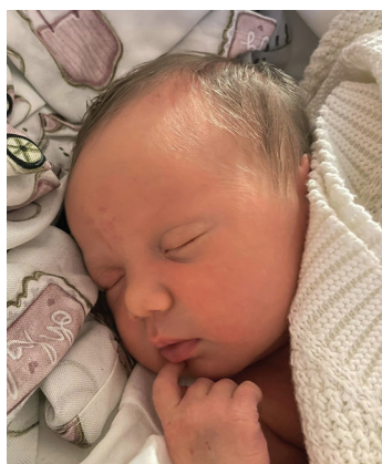
Maja , 7.01, 54 cm, 3830 g