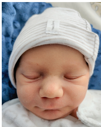
Nikodem , 18.01, 53 cm, 2600 g