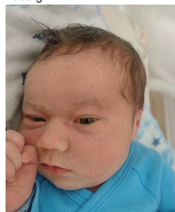
Milan , 10.01, 56 cm, 3840 g