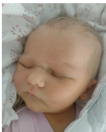
Wanda , 7.01, 54 cm, 3400 g