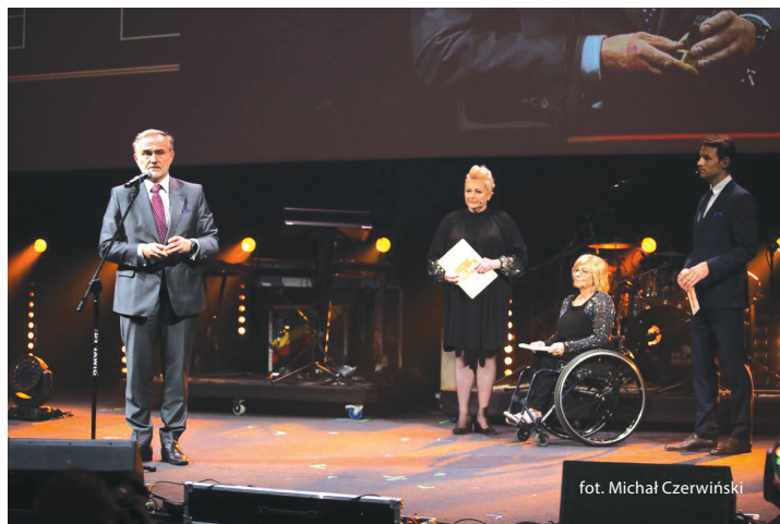
dejmuje na rzecz osób z niepełnosprawnością oraz uczynienie wizji „miasta bez barier” jednym z kluczowych elementów polityki lokalnego. Więcej na 2 str. „Ratusza”.

Kapituła Medalu Przyjaciół Integracji zwróciła szczególną uwagę na wieloletnie i wielopłaszczyznowe działania, jakie Gdynia po-