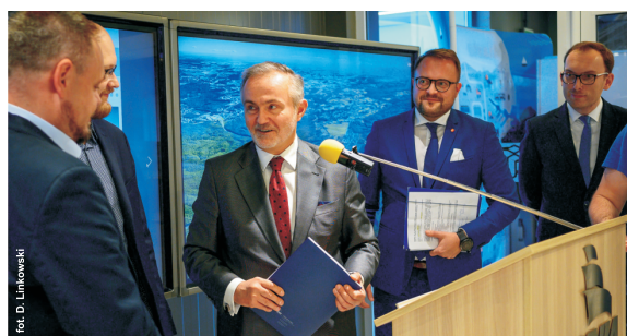
Podpisanie umowy na przebudowę ul. Hodowlanej