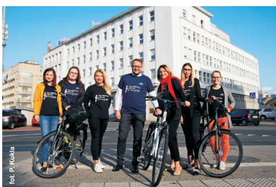
Samodzielny Referat ds. Energetyki