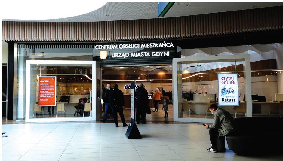
Centrum Obsługi Mieszkańca w CH Riviera, ul. Kazimierza Górskiego 2, I piętro.

Od 16 marca ukraińskim uchodźcom, którzy postanowią pozostać w naszym kraju, są nadawane numery PESEL. Formalności załatwić można w Centrum Obsługi Mieszkańca w Centrum Riviera (ul. Kazimierza Górskiego 2, I piętro).