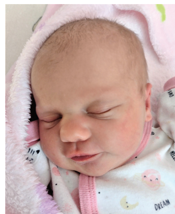
Malwina, 53cm, 2860g, 05.03.22