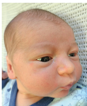
Leon, 56cm, 4000g, 27.02.22