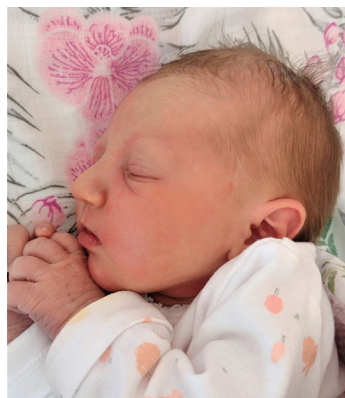
Córka, 50cm, 2940g, 07.03.22