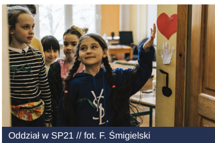
Oddział w SP21