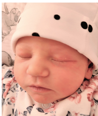
Iga, 54 cm, 2820 g, 10.04.22