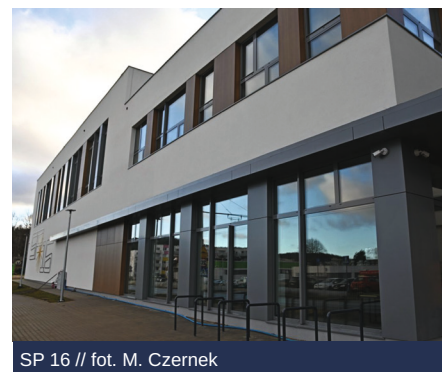
SP 16

Mimo oszczędności, w Gdyni prowadzone są duże inwestycje, powstają nowoczesne szkoły z doskonałą bazą sportową, miasto tworzy klasy sportowe, językowe oraz oddziały przygotowawcze dla dzieci i młodzieży ukraińskiej.