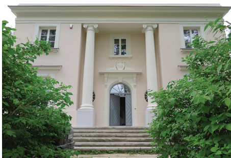
Część wejściowa do willi „Sokola” na Kamiennej Górze z lat 20. XX w. z wnęką i dwiema kolumnami.