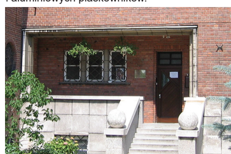
Wejście do klasztoru franciszkanów z lat 30. XX w. na Wzgórzu św. Maksymiliana z drzwiami w podcieniu.