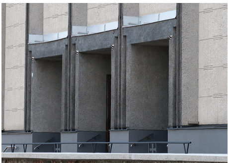
Potrójne wejście do kościoła Najświętszego Serca Pana Jezusa z lat 50. i 60. XX w.