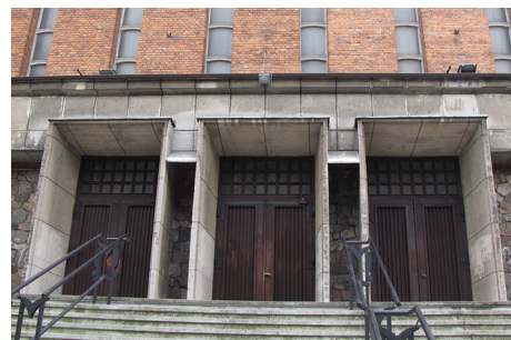
Potrójne wejście do kościoła franciszkanów z lat 50. i 60. XX w.

Opracowanie tekstu: Biuro Miejskiego Konserwatora Zabytków.