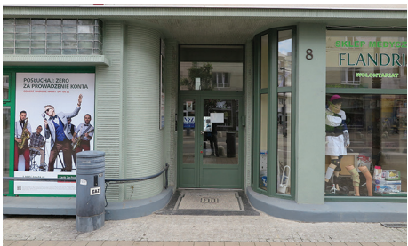
Wejście do kamienicy przy ul. Świętojańskiej 89 – charakterystyczne rozwiązanie modernistyczne z umieszczeniem drzwi we wnęce pomiędzy wytrynami.