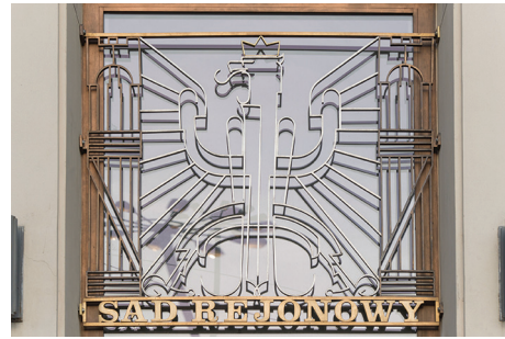
Wejście główne do Sądu Rejonowego z lat 30. XX w. przy placu Konstytucji, ozdobione dekoracją plastyczną z godłem, wykonaną z mosiężnych i aluminiowych płaskowników.