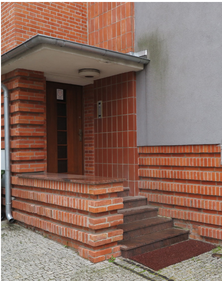
Wejście do willi modernistycznej na Kamiennej Górze z ceglany wykończeniem i żelbetowym daszkiem osłaniającym podest.