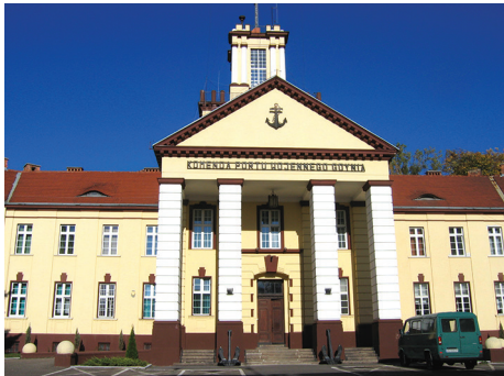
Część wejściowa do gmachu dawnego Dowództwa Floty z lat 20. XX w. na Oksywiu.

więcej osób, wejścia były podwójne a nawet potrójne. Potrójne wejścia budowano w ważnych budynkach publicznych, w tym w dużych świątyniach. Potrójne wejścia w prostych żelbetowych ramach, nawiązujące do portali historycznych katedr mamy np. w kilku gdyńskich kościołach modernistycznych.