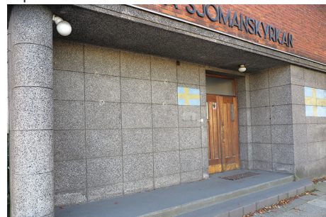
Wejście w podcieniu do dawnego Domu Marynarskiego z lat 30. XX w.