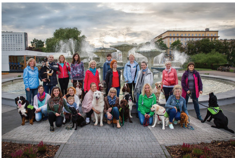
Fundacja Dogtor świętuje 20.urodziny // fot. Lucyna Lewandowska/FB Fundacja Dogtor

Czym jeszcze zajmuje się gdyńska fundacja? Na długiej liście jej działań znajdziemy m.in.: informowanie, poradnictwo i pomoc osobom zainteresowanym terapią z udziałem zwierząt, poradnictwo dla rodziców dzieci z niepełnosprawnościami w zakresie szkolenia własnych psów, szkolenie psów terapeutycznych z zastosowaniem standardów światowych, prowadzenie szeroko rozumianej edukacji humanitarnej, wprowadzanie nowych form terapeutycznych.