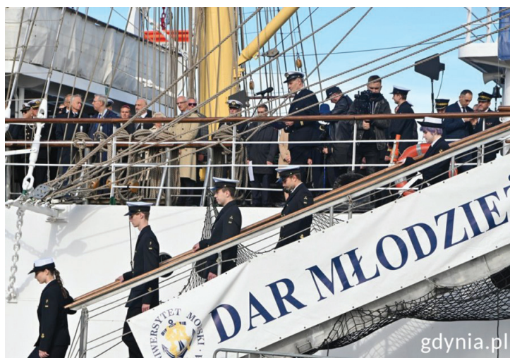
Kulminacyjnym punktem uroczystości było ślubowanie oraz immatrykulacja studentów pierwszego roku i doktorantów