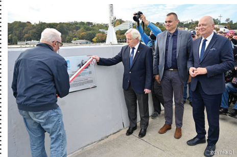
Odświeżenie tablicy ku pamięci Krystyny Chojnowskiej-Liskiewicz

8 października do grona zasłużonych ludzi morza w alei Żeglarstwa Polskiego dołączyła kolejna wybitna postać polskiego jachtingu. Tym razem specjalną tablicą została uhonorowana Krystyna Chojnowska-Liskiewicz – pierwsza kobieta w historii, która samotnie opłynęła świat. Wydarzenie odbyło się podczas XIV Złotu Jachtów z Duszą „Próchno i Rdza”.