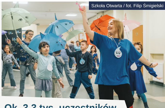
Szkoła Otwarta