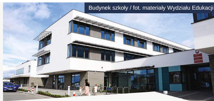
Budynek szkoły

84 tys. złotych gmina przeznaczyła w tym roku na dofinansowanie konkursów szkolnych. Organizowało je 27 placówek. Tematyka proponowanych zmagani jest naprawdę szeroka. Szkoły nie tylko chcą mierzyć się w tradycyjnych konkursach matematycznych czy ortograficznych ale coraz częściej stawiają na konkursy dotyczące dziedzin rozwijających się w szkołach i niezwykle atrakcyjnych dla uczniów. W tym roku odbyły się między innymi Otwarte Zawody Projektowania Obiektów Trójwymiarowych i Druku 3D, konkursy dotyczące języków obcych, a listę uzupełniły zmagania specjalistów z danych zawodów np. konkurs nakrywania stołów.