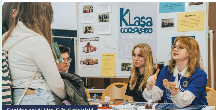
Ranking szkół

Powstało tam nowe trzykondygnacyjne skrzydło wraz z łącznikiem pomiędzy nową a starą częścią szkoły. Koszt budowy to przeszło 12 milionów złotych. W ponad rok powstał budynek o łącznej powierzchni 1643 m 2 . W nim znalazło się miejsce na m.in.: 13 sal lekcyjnych, w tym jedna do nauki gotowania, nowoczesna sala komputerowa, 3 pokoje do zajęć indywidualnych, pokój nauczycielski, a także szatnie i toalety. Dzięki windzie budynek jest w pełni dostosowany do potrzeb osób z niepełnosprawnościami. Zmieniło się też otoczenie placówki – powstało miejsce do wypoczynku, wiata na rowery, wprowadzono rozwiązania zwiększające dostępność – utwardzenie dróg pieszych i pieszo-jezdnych, zamontowano nowe urządzenia na placu zabaw.