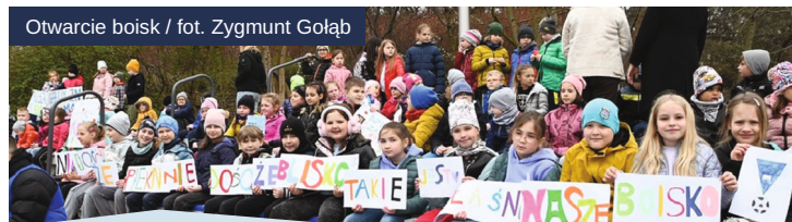
Otwarcie boisk