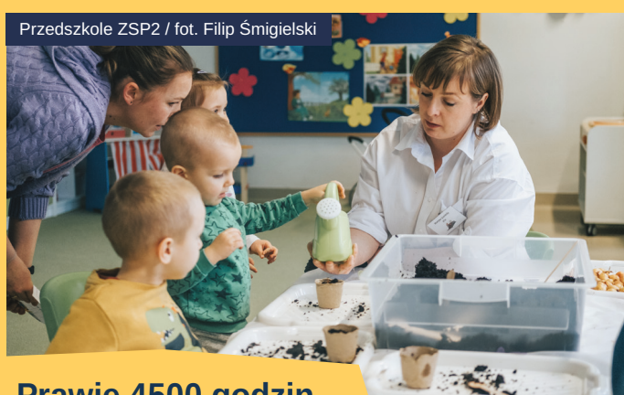
Przedszkole ZSP2

w 19 gdyńskich szkołach podstawowych wzięło udział w zajęciach „Szkoł Otwartych”. Zajęcia rozpoczęły się w semestrze letnim. Aktywności kierowane były do dzieci, a w części szkół również do dorosłych. Koszt tego zadania to ok. 1,1 mln zł. Wśród dodatkowych zajęć dużym powodzeniem cieszą się szkoły dla rodziców, jednak zdecydowana większość aktywności to działania skierowane do młodych. Oprócz zajęć sportowych i plastycznych szkoły postawiły na aktywności wspierające rozwój dzieci. Zajęcia grafomotoryczne, terapia pedagogiczna, treningi uważności to aktywności pojawiają się w wielu szkołach.