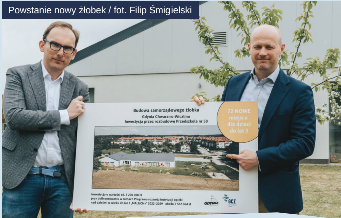
Powstanie nowy żłobek

Prawie 32 mln złotych – takie wsparcie trafia do Gdyni z Funduszu Narodów Zjednoczonych na Rzecz Dzieci UNICEF. Pieniądze są przeznaczone dla najmłodszych, których dotknęła wojna w Ukrainie. To zaś oznacza nie tylko małych uchodźców, ale wszystkie gdyńskie dzieci, które zmuszone są mierzyć się z nową, trudną rzeczywistością.