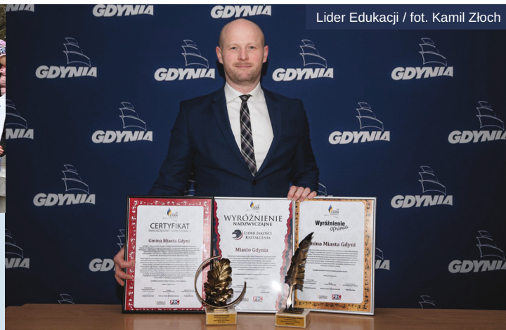
Lider Edukacji