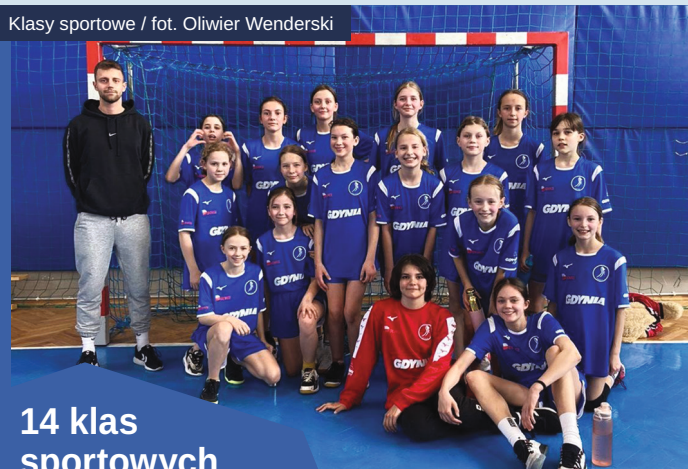
Klasy sportowe

przyjmie nowy żłobek w Gdyni, który powstanie w dzielnicy Chwarzno-Wiczlino. Znajdą się tu 3 oddziały, czyli 3 dodatkowe przestrzenie, które będą zlokalizowane w Przedszkolu nr 58. Placówka ta zostanie rozbudowana. To inwestycja o wartości ok. 3 200 000 zł.