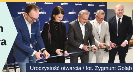
Uroczystość otwarcia

Powstało tam nowe trzykondygnacyjne skrzydło wraz z łącznikiem pomiędzy nową a starą częścią szkoły. Koszt budowy to przeszło 12 milionów złotych. W ponad rok powstał budynek o łącznej powierzchni 1643 m 2 . W nim znalazło się miejsce na m.in.: 13 sal lekcyjnych, w tym jedna do nauki gotowania, nowoczesna sala komputerowa, 3 pokoje do zajęć indywidualnych, pokój nauczycielski, a także szatnie i toalety. Dzięki windzie budynek jest w pełni dostosowany do potrzeb osób z niepełnosprawnościami. Zmieniło się też otoczenie placówki – powstało miejsce do wypoczynku, wiata na rowery, wprowadzono rozwiązania zwiększające dostępność – utwardzenie dróg pieszych i pieszo-jezdnych, zamontowano nowe urządzenia na placu zabaw.