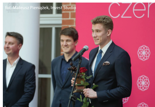
Naukowo-Technologicznym. Jest też finalistą tegorocznej edycji konkursu Gdyni Biznesplan. Gratulacje!

Najlepszy student na Pomorzu jest także pomysłodawcą i organizatorem wielu projektów o charakterze społecznym i charytatywnym. Współpracuje m.in. ze Stowarzyszeniem Hospicjum im. Św. Wawrzyńca, Wymiennikownią, Fundacją Dbam o mój zasięg, Laboratorium Innowacji Społecznych i Pomorskim Parkiem