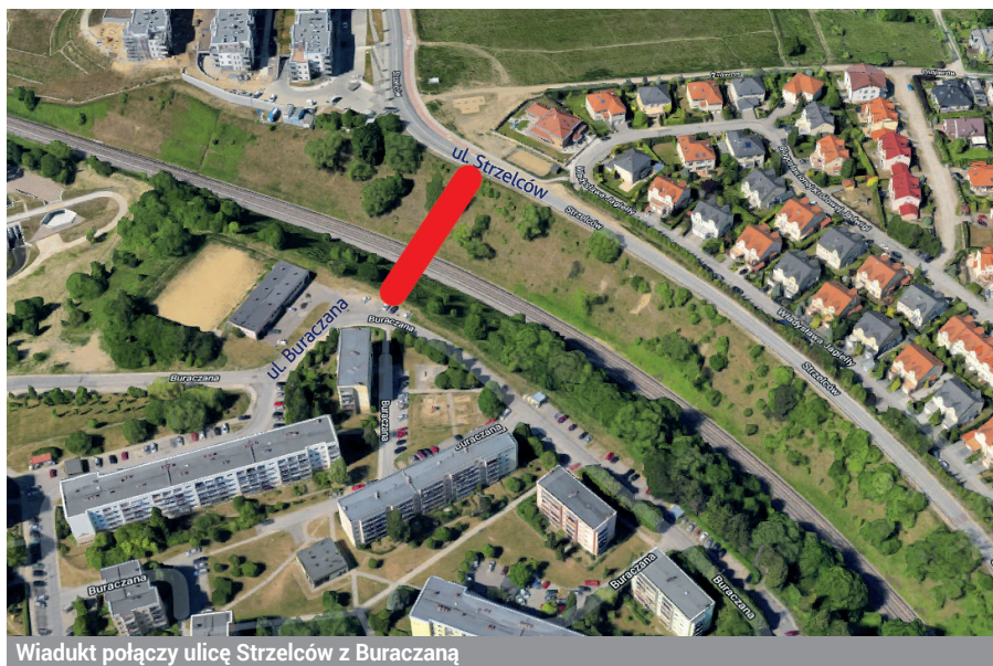
Wiadukt połączy ulicę Strzelców z Buraczaną