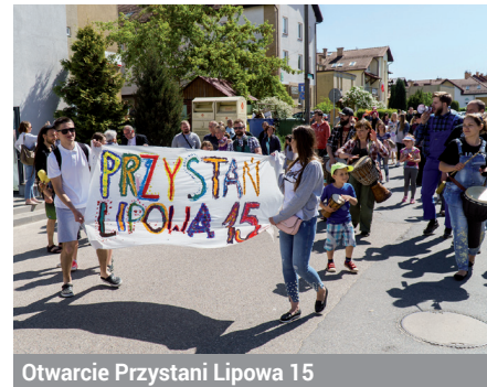
Otwarcie Przystani Lipowa 15

Na dobry początek działalności Przystani po osiedlu przeszła parada. Przed budynkiem trwały warsztaty bębniarskie i kuglarskie. Najmłodsi puszczali wielkie mydlane bańki i malowali na asfalcie. Podczas Sądzieckiej Herbatki kilkudziesięciu mieszkańców rozmawiało o możliwościach,