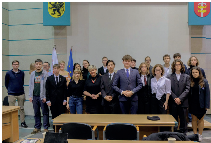
Na zdjęciu młodzi radni wraz z opiekunem oraz zaproszeni goście

Kolejnym punktem harmonogramu były raporty prac komisji: ds. promocji, ds. zdrowia, ds. organizacji targów szkół, ds. edukacji, ds. ochrony środowiska, ds. dostępności osób niepełnosprawnych, ds. kultury oraz ds. rewizyjnych. Sporo do zreferowania miała komisja ds. zdrowia psychicznego. Za MRM jeden duży i udany Kongres Zdrowia Psychicznego, a przed nimi organizacja kolejnego, który