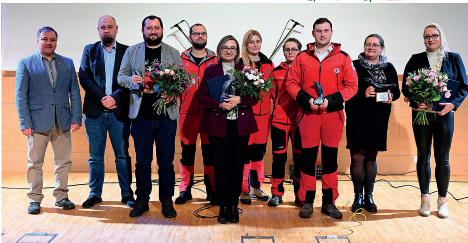
Na zdjęciu: laureaci Srebrnego Śledzia i Wieloryba Pozarządowego

– Michał Miegoń animator kultury, kierownik działu Komunikacji i Promocji