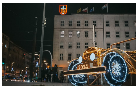
Samochód świętego Mikołaja przy Urzędzie Miasta