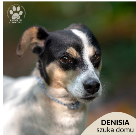
DENISIA szuka domu

Kontynuujemy rubrykę, dzięki której, mamy nadzieję, kolejne porzucone psy i koty ze schroniska w „Ciapkowie” znajdą ciepły dom.