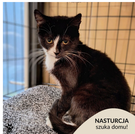
NASTURCJA szuka domu!

Psinka jest zaszczepiona, po wszystkich niezbędnych szczepieniach.