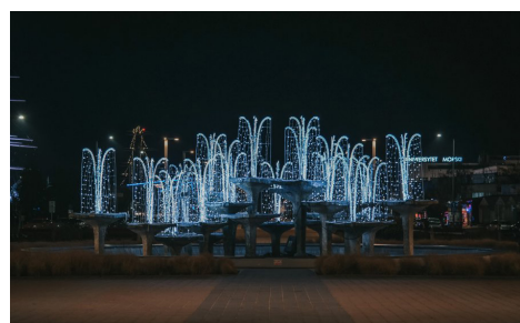
Fontanny miejskie na skwerze Kościuszki

Nie zabrakło efektownych, przestrzennych dekoracji świetlnych w postaci żagli ustawionych przy węzłach przesiadkowych, placach oraz skwerach. Po raz kolejny przy nabrzeżu Pomorskim rozblęsnęła choinka na Darze Młodości. W Parku Centralnym przy Urzędzie Miasta można zrobić sobie zdjęcie przy udekorowanym świątecznym drzewku i samochodzie Świętego Mikołaja. Dekoracje będą ozdabiać miasto do 2 lutego.