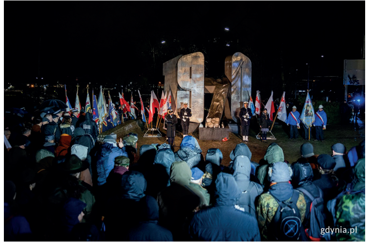
Poranne uroczystości odbyły się pod Pomnikiem Ofiar Grudnia 1970 w Gdyni

Pamięć o Grudniu '70 jest wciąż żywa. Wspominając ofiary tamtych wydarzeń, gdynianie oddali hold tym, którzy odważyli się przeciwstawić niesprawiedliwości i walczyć o lepsze jutro.