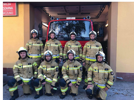
fol. OSP Wiczlino

Spółdzielnia gotuje zupę dla potrzebujących (m.in. osób w kryzysie bezdomności) wydawaną przy kościele. W soboty, kiedy zwykłe na ciepły posiłek przychodzi więcej osób, przy jego wydawaniu pomagają wolontariusze z parafii. Dzięki temu nawiązują bezpośredni kontakt z osobami w kryzysach, co stwarza okazję do pracy z nimi.