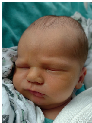
Antoni , 53 cm, 3630 g, 27.02