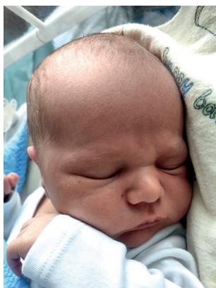
Dante , 56 cm, 3960 g, 15.02