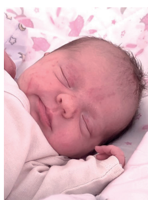
Hanna , 51 cm, 2920 g, 05.03