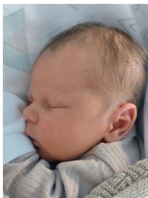
Antoni , 53cm, 3530 g, 16.02