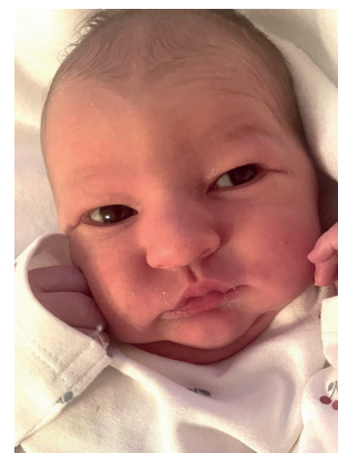
Carmen , 51 cm, 3430 g, 30.01