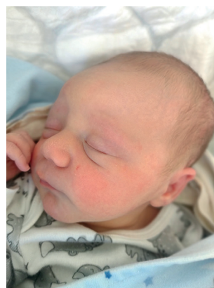
Przemysław , 50 cm , 3150 g, 06.03