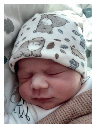
Igor , 50 cm, 3310 g, 07.03