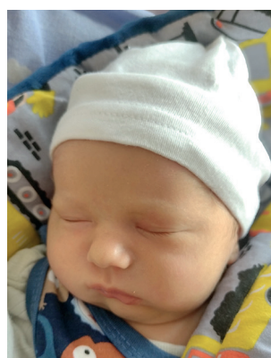
Leon , 50 cm, 3020 g, 29.02