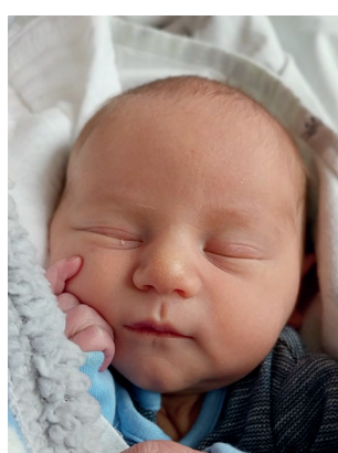
Olaf , 52 cm, 3150 g, 28.02