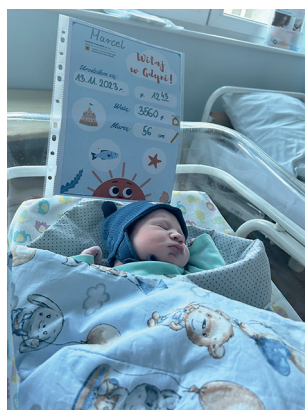
Marcel , 56 cm, 3560 g, 13.11