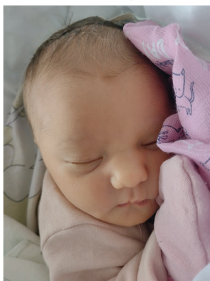
Iga , 3.01, 58 cm, 3670 g