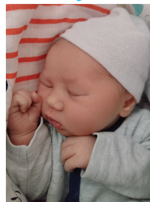
Laura , 4.01, 53 cm, 3450 g