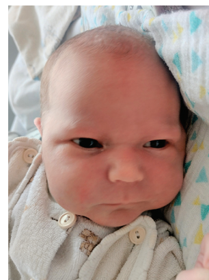
Maja , 9.01, 54 cm, 3310 g