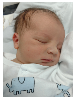
Marcel , 4.01, 50 cm, 3300 g