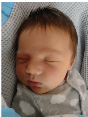
Maja , 2.01, 57 cm, 3600 g