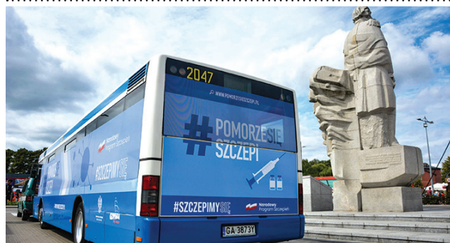
Działanie Szczepibusu Wojewódzkiego zainaugurowano 15 sierpnia w Kościerzynie

W związku z projektem zawarte zostało partnerstwo, w ramach którego PSONI Koło w Gdyni będzie współpracować z miastem i jego jednostkami w celu rekrutacji i opracowania indywidualnych ścieżek reintegracji uczestników projektu. Projekt SamoDZIELNI – Dzienny Ośrodek Opieki Wytchnieniowej i Rehabilitacji Społecznej „Osiedle Młodych” uzyskał dofinansowanie w ramach Działania 06.02. Usługi Społeczne Regionalnego Programu Operacyjnego Województwa Pomorskiego na lata 2014-2020.