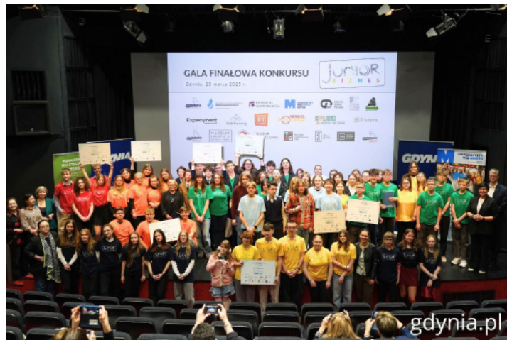
Finałiści 8. edycji konkursu Junior Biznes

Laureatów prezentujemy na 3 str. „Ratusza”.