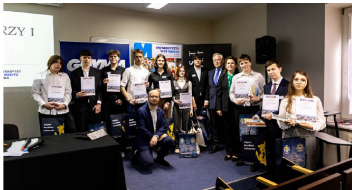
Laureaci w kategorii Szkoły Średnie

Gratulujemy laureatom i wszystkim uczestnikom!