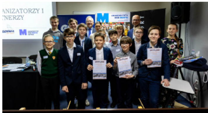
Laureaci w kategorii Szkoły Podstawowe