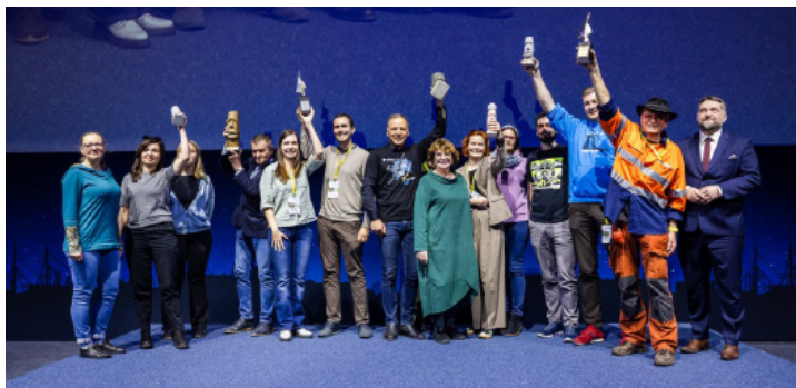
Drugi dzień 27. Ogólnopolskich Spotkań Podróżników, Żeglarzy i Alpinistów odśpiewali pierwszych laureatów tegorocznej edycji