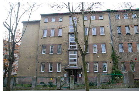
ul. Krasickiego 38