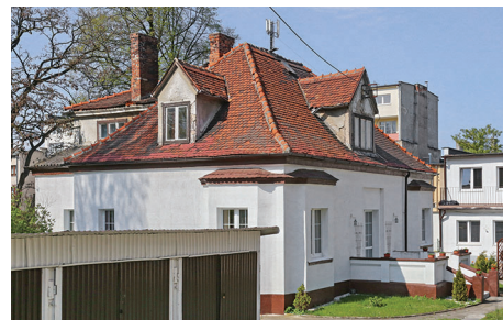
ul. Komandorska 18