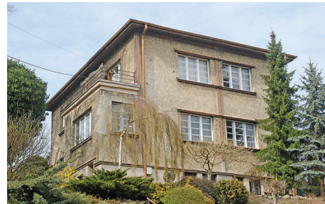
ul. Tatrzańska 16