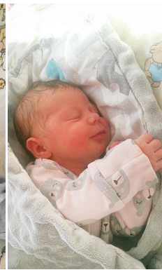
Iga, 28.03, 3260 g, 56 cm