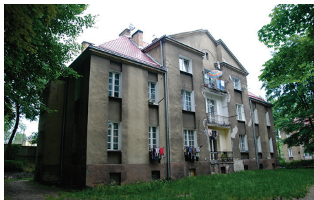
ul. Arciszewskich 26