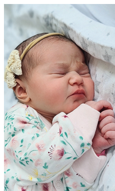
Pola, 28.03, 3410 g, 56 cm