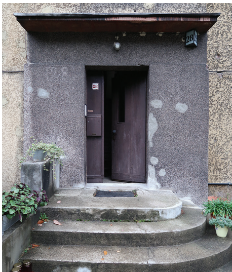
ul. Olsztyńska 28

Dziewięć spośród wymienionych budynków otrzymało dotacje po raz pierwszy. Poniżej prezentujemy ich zdjęcia: