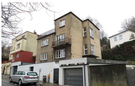
ul. Sienkiewicza 6