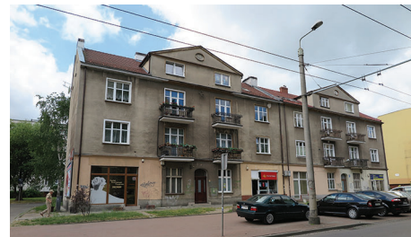
ul. Chylońska 65-67