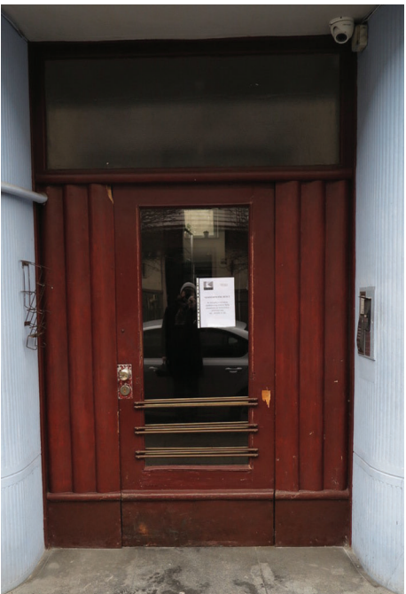
ul. Bema 4