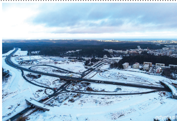
Na budowie drogi ekspresowej S6 w Gdyni praca w re