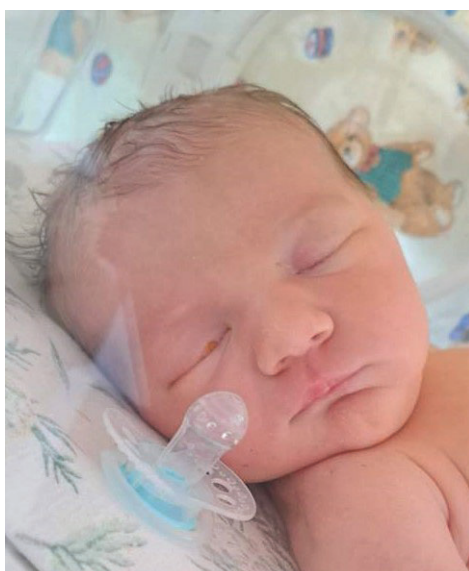
Kornelia , 28.12, 57 cm, 3540 g