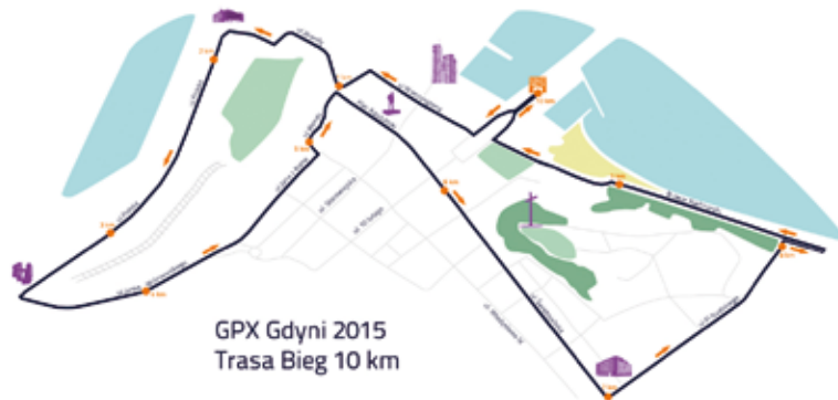
GPX Gdyni 2015 Trasa Bieg 10 km