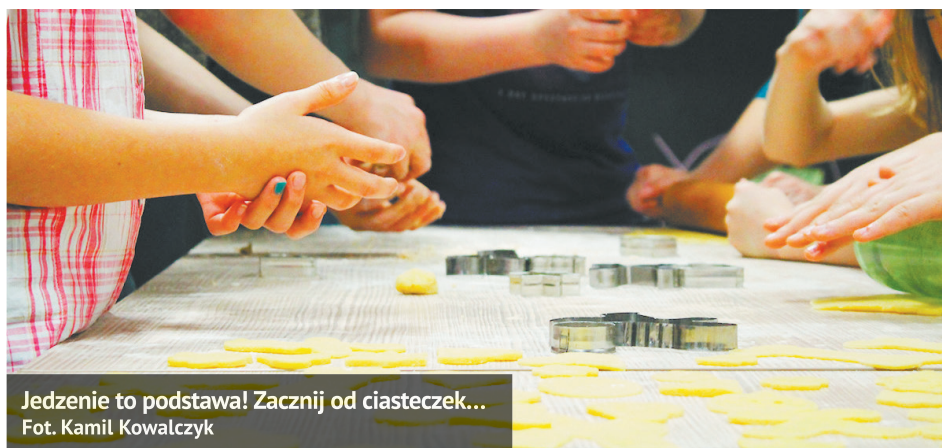
Jedzenie to podstawa! Zaczynaj od ciasteczek...