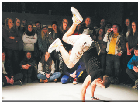
Świat na głowie – czyli ludzie zakręcony na punkcie tańca.

Cykl: BICYKL w poniedziałki od godz. 17:00. Odkręcanie, smarowanie i regulowa-