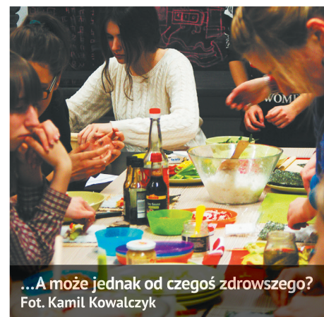
...A może jednak od czegoś zdrowszego?