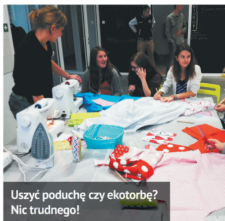
Uszyć poduchę czy ekotorbę? Nic trudnego!