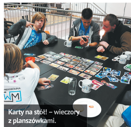
Karty na stół! – wieczory z planszówkami.