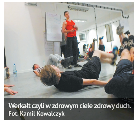
Werkalt czyli w zdrowym ciele zdrowy duch.

Grafik zajęć jest cały czas rozszerzany, a oprócz cyklicznych zajęć odbywają się organizowane na bieżąco warsztaty (np. kulinarne) i wieczory (filmowe, podróżnicze, kulturowe). Sprawdź nasz profil na Facebooku, by niczego nie przegapić.