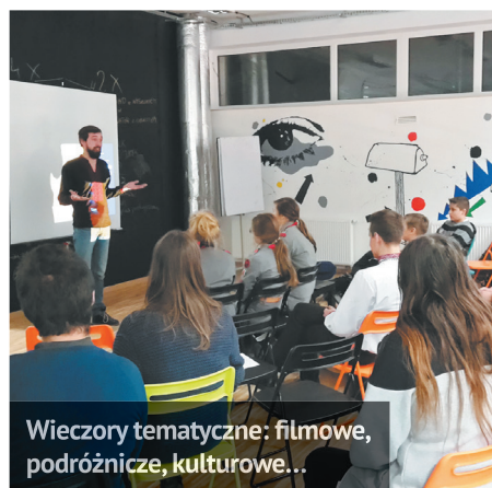
Wieczory tematyczne: filmowe, podróżnicze, kulturowe...