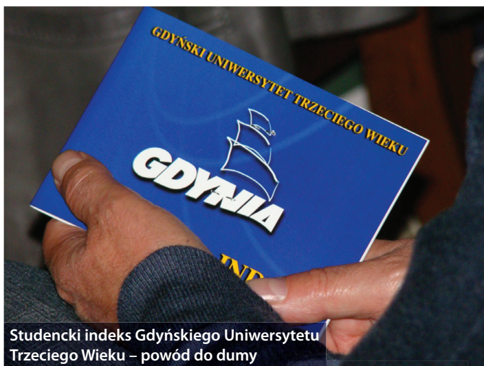
Studencki indeks Gdyńskiego Uniwersytetu Trzeciego Wieku – powód do dumy

Więcej informacji, w tym wykaz Klubów Seniora: