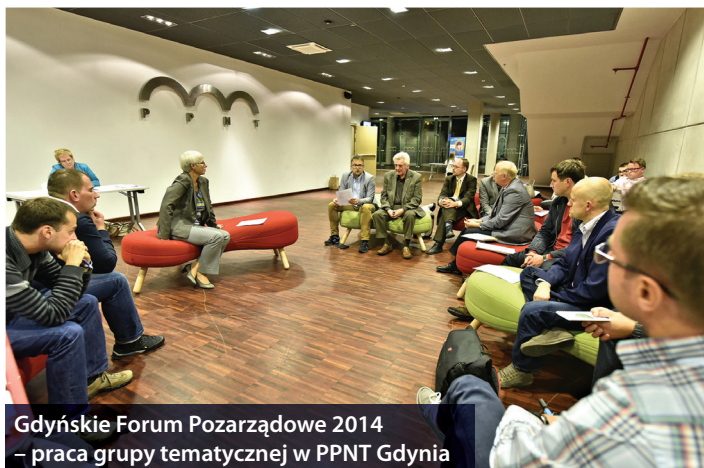
Gdyńskie Forum Pozarządowe 2014 – praca grupy tematycznej w PPNT Gdynia

1 października Pomorski Park Naukowo-Technologiczny w Gdyni gościł ponad 130 przedstawicieli organizacji pozarządowych, radnych i pracowników miejskich jednostek. Była to okazja, by podsumować kolejny rok współpracy miasta z organizacjami i przedstawić dokonania Gdyńskiej Rady Działalności Pożytku Publicznego. Uczestnicy dyskutowali nad projektem Wieloletniego Programu Współpracy Miasta Gdyni z Organizacjami Pozarządowymi na lata 2015-2020. Gdyńskie Forum Pozarządowe to doskonała przestrzeń do wypracowywania miejskich rozwiązań w dialogu z przedstawicielami sektora pozarządowego.