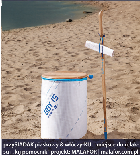
przySIADAK piaskowy & włóczy-KIJ - miejsce do relaksu i „kij pomocnik” projekt: MALAFOR | malafor.com.pl