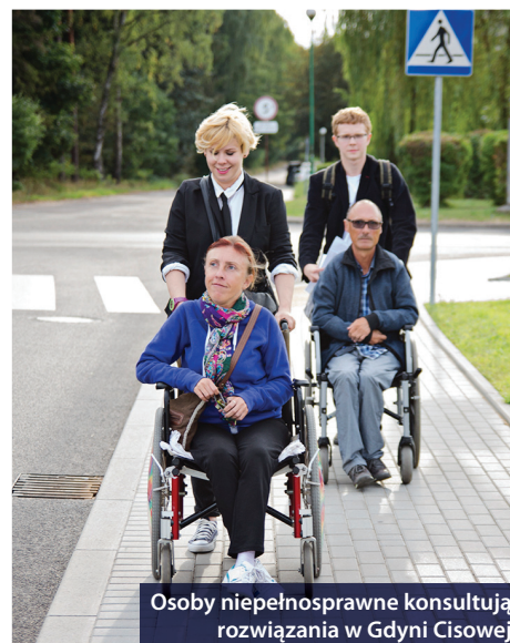
Osoby niepełnosprawne konsultują rozwiązania w Gdyni Cisowej

Kij pomocnik - do spacerowania i do wstawania. Ideą jest wyposażenie gdyńskiej plaży w kije na stałe. Wchodząc na plażę moglibyśmy wziąć kij, a przy wyjściu zostawić go dla kolejnych spacerowiczów.