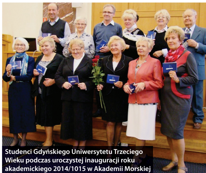
Studenci Gdyńskiego Uniwersytetu Trzeciego Wieku podczas uroczystej inauguracji roku akademickiego 2014/2015 w Akademii Morskiej

Szczegółowy grafik zajęć dostępny jest na stronie Centrum Aktywności Seniora www.cas.gdynia.pl .