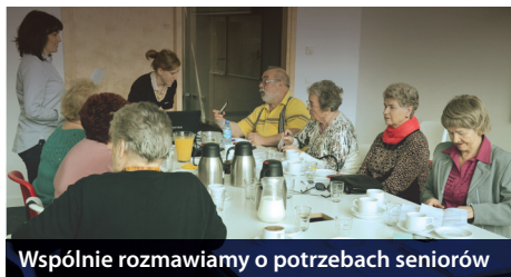
Wspólnie rozmawiamy o potrzebach seniorów

■ W imieniu organizacji Citizen Projects, zapraszamy osoby w wieku 55+ na warsztaty „Dialog – Jak zaczynać?”. Porozmawiamy o tematach trudnych (tabu), o wykluczeniu i dyskryminacji w życiu codziennym, w relacjach z sąsiadami, rodziną.