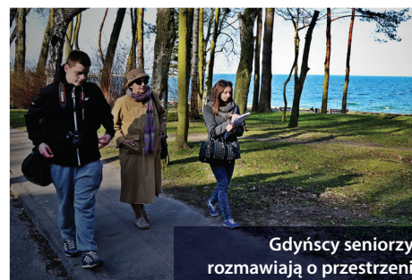
Gdyńscy seniorzy rozmawiają o przestrzeni

Co poprawić, ulepszyć, zmodernizować w Śródmieściu Gdyni? Właśnie trwa analiza wniosków ze spacerów badawczych – inicjatywy, w ramach której seniorzy spacerując po mieście oceniają przestrzeń i opowiadają o tym, co należałoby zmienić, aby miasto było jeszcze lepiej przystosowane dla osób starszych.