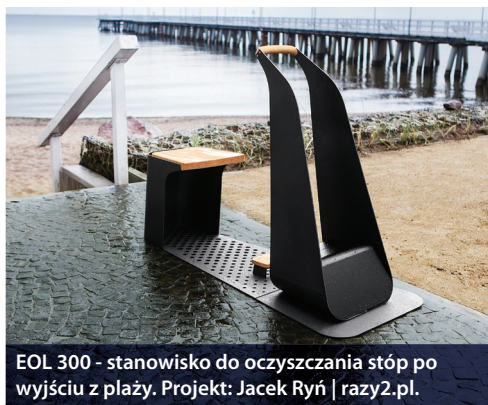
EOL 300 - stanowisko do oczyszczania stóp po wyjściu z plaży. Projekt: Jacek Ryń | razy2.pl.

Czy plaża może się zmieniać? Uczynić plażę miejscem jeszcze bardziej otwartym, spełniającym potrzeby seniorów - taka idea przyświecała projektowi PLAŻA 60+ , realizowanemu podczas festiwalu Gdynia Design Days 2014. Zaprojektowano propozycje konkretnych obiektów, mogących ułatwiać korzystanie z plaży: stanowisko do oczyszczania stóp po wyjściu z plaży, z ergonomicznym siedziskiem i podnóżkiem, czy też przysiadak plażowy, który pozwala odpocząć podczas spaceru brzegiem morza. Więcej informacji o tych, a także o innych, ciekawych prototypach na stronie www.gdyniadesigndays.eu/prototypy-w-ramach-gdd-2014 oraz w Laboratorium Innowacji Społecznych PPNT Gdynia.