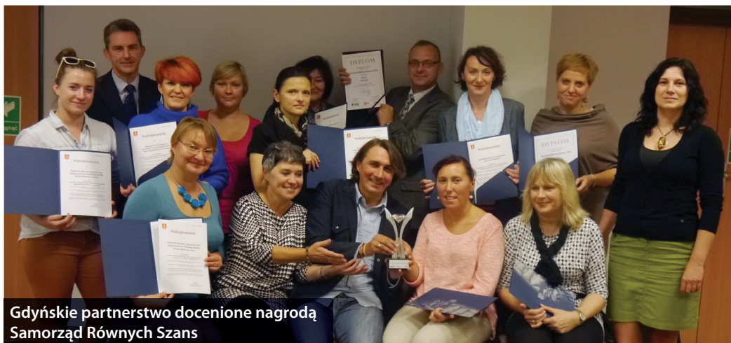
Gdyńskie partnerstwo docenione nagrodą Samorząd Równych Szans