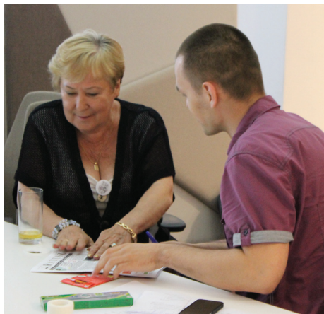
Miejski Service Design w PPNT Gdynia. Wspólne rozmowy o interaktywnej tablicy.

■ W imieniu organizacji Citizen Projects, zapraszamy osoby w wieku 55+ na warsztaty „Dialog – Jak zaczynać?”. Porozmawiamy o tematach trudnych (tabu), o wykluczeniu i dyskryminacji w życiu codziennym, w relacjach z sąsiadami, rodziną.