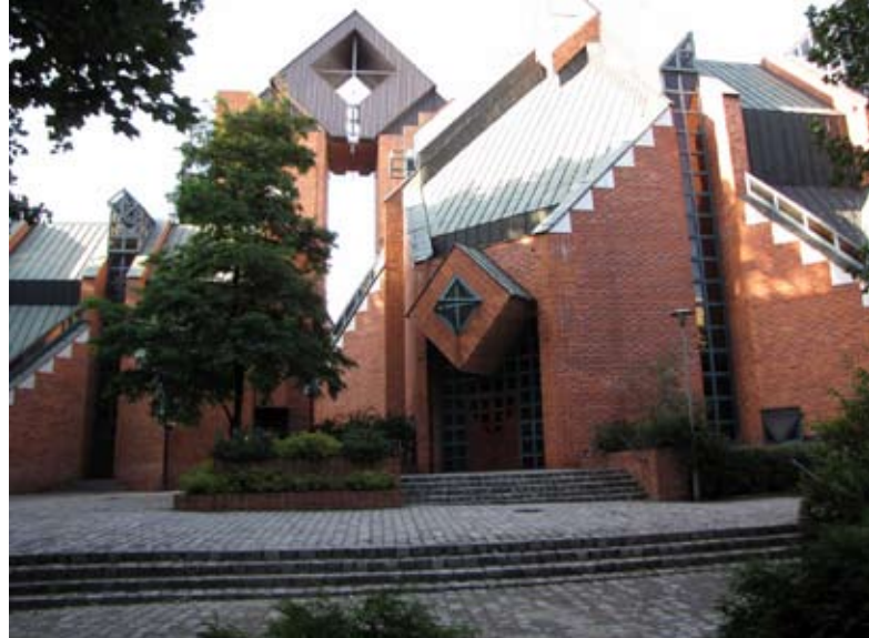
5. Kościół p.w. Matki Bożej Królowej Pokoju przy ulicy Ojców Oblatów (powstały 1982) autorzy Wojciech Jarzabek, Jan Matkowski, Waław Hryniewiecki.

To właśnie ten detal definiuje wygląd przyozdobionych nim obiektów, dodając im oryginalności i wyrazistości. Stał się również inspiracją podczas projektowania ornamentów i zdobień dla nowopowstających w mieście budynków. Wydaje się, że właśnie motyw trójkąta został najlepiej zasymilowany we wrocławskiej architekturze końca XX wieku. Na elewacjach powstających na przełomie XX i XXI w. obiektów użyteczności publicznej pojawiają się liczne motywy łądzące podobne do tych spotykanych na fasadach z lat 20. Przykłady trójkątnych i kryształowych dekoracji ujawniają się szczególnie w twórczości Wojciecha Jarząbka. Odnajdziemy je na fasadach takich realizacji jak: kościół na osiedlu Popowice (1980-95), dom handlowy „Solpol” (1993), dom wielorodzinny przy wybrzeżu Wyspiańskiego nr 36 (1996), biurowce: „Descout” przy ul. Strzegomskiej 42 (1999), Dolnośląskiego Urzędu Skarbowego przy ul. Żmigrodzkiej 141 (2000). Pojawiają się także obficie w prestiżowych realizacjach innych tworzących w tym czasie architektów, np. kryształ i trójkąt są dominującymi motywami parkingu wielopoziomowego przy ul. Szewskiej 3a autorstwa Stefana Millera. Zasięg występowania tego