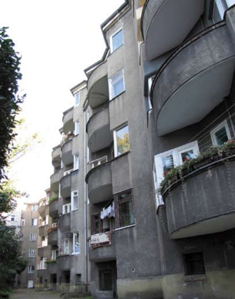
2. Budynek wielorodzinny przy ulicy Walecznych 30-54 (powstały 1927-28) autor Ludwig Moshamer, Fot. Marta M. Rudnicka

Ogólnie panującym poglądem jest, że architektura modernistyczna opierała się na nowej metodzie twórczej, wywodzącej formę i konstrukcję budynku niemal wyłącznie z zadanych uwarunkowań funkcjonalnych. Jak każda prawda generalna, tak i ta przy bliższym wejrzeniu okazuje się być półprawdą. Omawiając architekturę modernistyczną pierwszej połowy XX wieku, należy wziąć pod uwagę powyższe i włączyć w obszar zainteresowania nie tylko tę sensu stricte modernistyczną – pozbawioną ornamentu jako takiego – ale także tę, dla której ornament ma podstawowe znaczenie – ekspresjonistyczną.